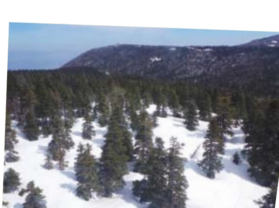
الإشجار وسط الجليد على القمة