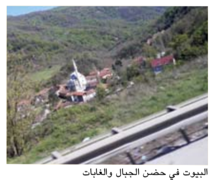
البيوت في حوض الجبال والغابات

المتوجه من اسطنبول إلى بورصة يشاهد في الطريق بانوراما رائعة من المشاهد المتباينة رائعة الجمال. ففي بداية الطريق تمر على مضيق البوسفور إحدى النقاط استراتيجية في العالم. وهناك مشاهد الورد في كل مكان على جانبي الطريق عند الخروج من اسطنبول. المشهد الأروع الذي يمتد لمسافة أطول خلال هذا التنقل هو الغابات الممتدة على مد البصر بشكلها الجميل الذي يدخل في النفس الراحة والسكينة. كذلك هناك البيوت المتناثرة هنا وهناك وسط الجبال.