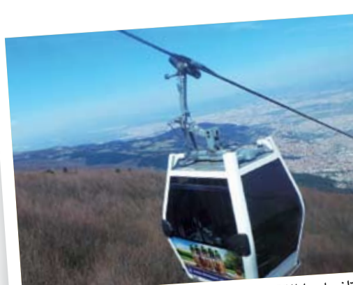
التلفريك وإطلالة على مدينة بورصة

في مشهد رائع ووسط الجبال والمرتفعات التي تغطيها الأشجار والورد والنباتات المختلفة، كان موعدنا مع الغداء. اصطحبنا المرشد إلى مطعم رائع يحمل اسم «الطبيعة» حيث الأطعمة التقليدية وأبرزها المشاوي على الطريقة التركية. كانت لافتة أيضا مظاهر الطبيعة والقريبة من الريف حتى أن الدجاج كان يسير بين طاولات المطعم.