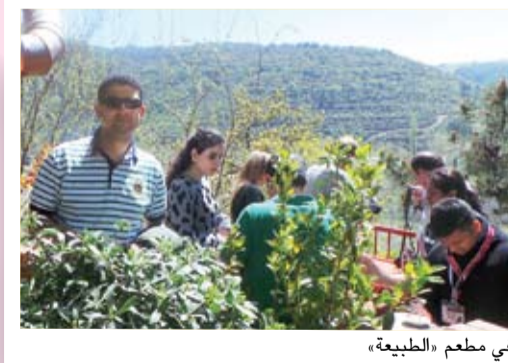
في مطعم «الطبيعة»

في مشهد رائع ووسط الجبال والمرتفعات التي تغطيها الأشجار والورد والنباتات المختلفة، كان موعدنا مع الغداء. اصطحبنا المرشد إلى مطعم رائع يحمل اسم «الطبيعة» حيث الأطعمة التقليدية وأبرزها المشاوي على الطريقة التركية. كانت لافتة أيضا مظاهر الطبيعة والقريبة من الريف حتى أن الدجاج كان يسير بين طاولات المطعم.