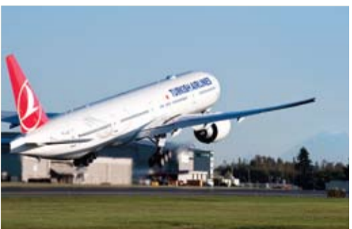
إحدى طائرات «التركية».

تأسست الخطوط الجوية التركية عام 1933 بإسطنبول مؤلف من 5 طائرات فقط. وشهدت عمليات الشركة، التي تحمل عضوية «ستار الأينس»، توسعا كبيرا لتصبح اليوم شركة طيران عالمية من فئة أربعة نجوم بإسطنبول يضم 269 طائرة ركاب وشحن، وتسيير رحلاتها إلى 265 وجهة حول العالم. وحصلت الناقلة، التي تعد واحدة من أسرع شركات الطيران نموا، على العديد من «جوائز اختيار الركاب» من «رابطة شركات الطيران لتجارب الركاب» (APEX). وبحسب استطلاع رأي «سكاي تراكس» لعام 2014، تم اختيار الخطوط الجوية التركية «أفضل شركة طيران في أوروبا»، للعام الرابع على التوالي. كما حصلت الخطوط الجوية التركية، التي فازت بجائزة «أفضل خدمة طعام على متن الدرجة السياحية»، في العالم في 2010 وجائزة «أفضل خدمة طعام على متن درجة رجال الأعمال»، في العالم في 2013، وعلى جائزتي «أفضل خدمة طعام على متن درجة رجال الأعمال» و«أفضل خدمة طعام في صالة سفر درجة رجال الأعمال» في العالم لهذا العام ضمن استطلاع «سكاي تراكس».