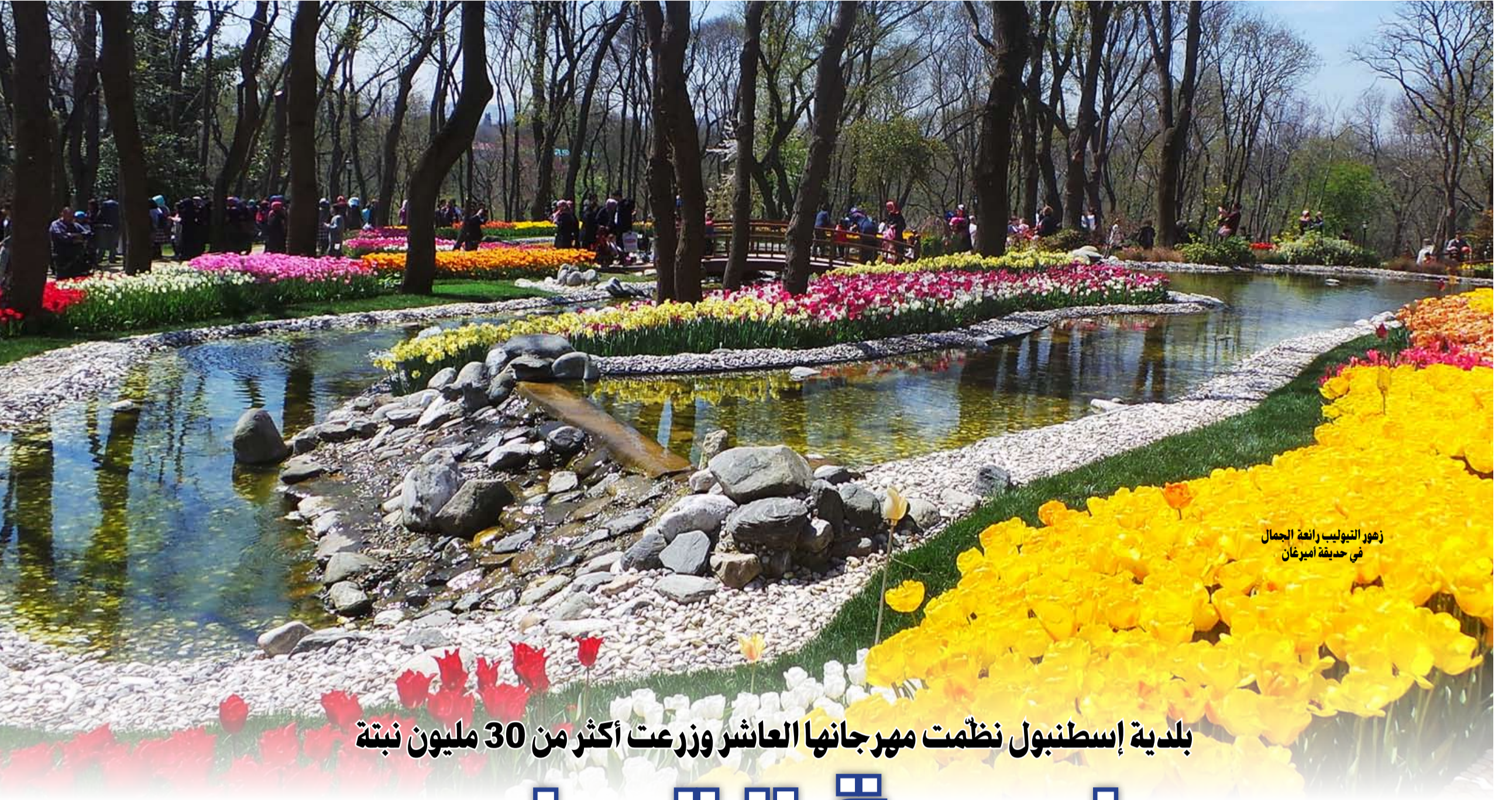
زهرة التيووليب رائعة الجمال في حديقة إمبرغان

بلدية إسطنبول نظّمت مهرجانها العاشر وزرعت أكثر من 30 مليون نبتة