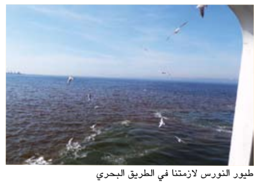
طيور النورس لآزمتنا في الطريق البحري

في منتصف الطريق من اسطنبول تحمل الحافلة عبارة لتقطع بحر مرمره وصولا إلى بورصة. على ظهر العبارة تتاح الفرصة لمشاهدة المدينتين من البحر وما أجملهما. في أثناء هذه الرحلة البحرية تقترب طيور النورس الجميلة من العبارة وكأنها تربطها مع الركاب صداقة من نوع خاص، وتقترب كثيرا حتى يطعمها الركاب «السميط» التركي في تجربة رائعة الجمال.