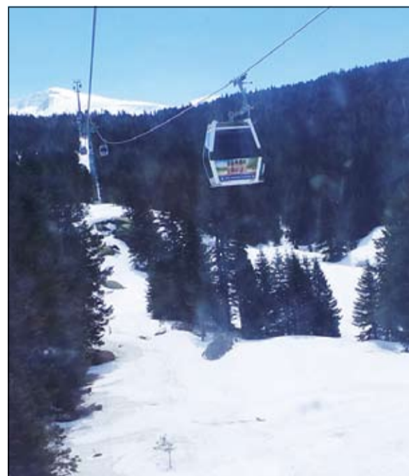
قمرات التلفريك تتحرك باتجاه قمة «الأولوداغ»

كانت المناظر خلابة وآسرة للآلبياب، فهاهي مدينة بورصة ببيوتها عريقة الطراز جميلة موعدا مع الحدث الأبرز لكل من يزور بورصة سائحا الأ وهو التلفريك. منذ اللحظة الأولى