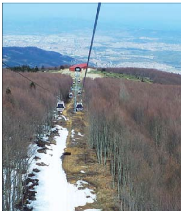
بورصة والغابات تتراءى للناظر من التلفريك

وكان علينا أن نتحرك لنترك طعام الغداء في مطعم رائع وسط الطبيعة الجبلية الخضراء لبورصة.