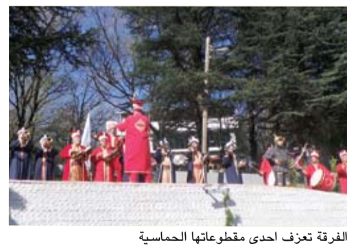
الفرقة تعزف إحدى مقطوعاتها الحماسية

لدى وصولنا إلى تلفريك بورصة كان في استقبالنا فرقة موسيقية عسكرية بزيناها التقليدي العثماني لتعزف مجموعة من معزوفاتها الحماسية وتذكرنا بهذا الدور الكبير الذي كانت تقوم به مثل هذه الفرقة في إلهاب حماس الجيوش العثمانية الفاتحة قبيل كل معركة. بعد هذا العرض الموسيقي الحماسي انطلق الوفد بكل عزم وإقدام إلى معركة التلفريك.