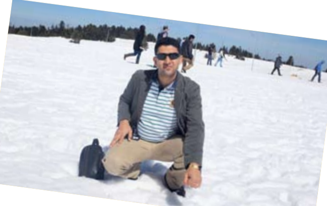
استراحة محارب على جليد قمة الأولوداغ