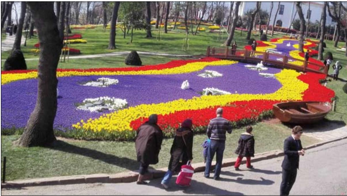
لوحة من زهور التيووليب بألوان ساحرة في وسط حديقة إمبرغان

للتيووليب، الذي أطلق في عام 2005 لأول مرة تحت شعار «إسطنبول تلتقي التيووليب»، بواسطة بلدية إسطنبول منوربوليتان، وإدارة المتنزهات وحدائق، حيث استضافت حديقة «إمبرغان» وحديقة «جوزتني 60 عاما» المهرجان الذي اشتمل على العديد من الفعاليات. وازدهرت أزهار التيووليب في حدائق وميادين متنزهات إسطنبول في إطار المهرجان. تمت زراعة ملايين زهور التيووليب في حدائق إسطنبول في إطار المهرجان، حيث احتضنت حديقة «إمبرغان» 2,800,000 زهرة تيووليب من نوعا مختلفا، بينما ضمت حديقة «جوزتني 60 عاما» 1,187,000 زهرة تيووليب من 161 نوعا. في حين أنبعت في حديقة «جولهانة» 1,379,000 زهرة تيووليب من 86 نوعا مختلفا. أما حديقة «يلدن» فازدانت بنحو 730,000 ألف زهرة تيووليب من 32 نوعا.