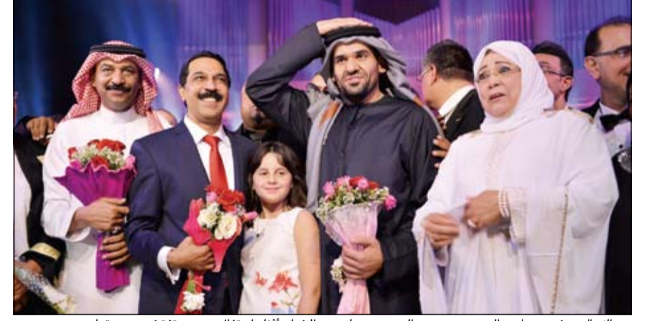
عبدالله الرويشد وعيادي الجوهري وحسين الجسمي وإسامين الخيام أثناء احتفال «مصر تفتخر بعروبيتها»

وللعلم هذه الدكتوراه تم منحها مرة واحدة للموسيقار الكبير محمد عبدالوهاب منذ 20 عاما، وقررت إعادتها مرة أخرى من أجل عيون من ساندوا مصر وحين عرضت الفكرة على وزير الثقافة عبد الواحد النوبي وافق على الفور ورحب بالفكرة ودعمها. وتابعت: أما بخصوص تكريم الفنانة الفديرة شادية فقد تم منحها الدكتوراه الفخرية تقديرا لدورها العظيم والرأسي في خدمة الفن واعترافا بما قدمه نجوم ورموز مصر للفن العربي على أن يصبح تقليدا سنويا تكرم من خلاله من ساهموا في خدمة الفن المصري ووضعنا قائمة طويلة بالأسماء التي تستحق التكريم العام القادم، وقد خاطبت الرائعة شادية عن تكريمها ووافقت وأبدت ترحيبها وسعادتها بهذا التكريم من الأكاديمية وسجلت بصوتها رسالة للاحتفالية شكرت فيها مصر وتمنت لها الخير والسلامة وبدا صوتها متعبا ومجهدا، ورشحت ابن شقيقها خالد شاكر لتسلم الدكتوراه الفخرية وشهادة التقدير لعدم قدرتها صحيا على الحضور بنفسها، وسوف نقوم بزيارتها في منزلها لشكرها على مشاركتها الفني الممل بالابداع والاحترام. وأضافت د.احلام: الكويت تربطنا بها علاقات وثيقة ووقعتنا اتفاقية تعاون بين أكاديمتي الفنون بالدولتين ونقيم العديد من ورش العمل ومناقشة رسائل الدكتوراه والماجستير، وعلى المستوى الشخصي اعتبر ابن الكويت بلدي الثاني.