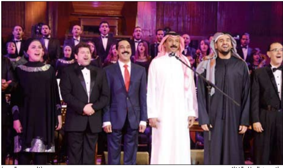
جانبا من الحفل الغنائي