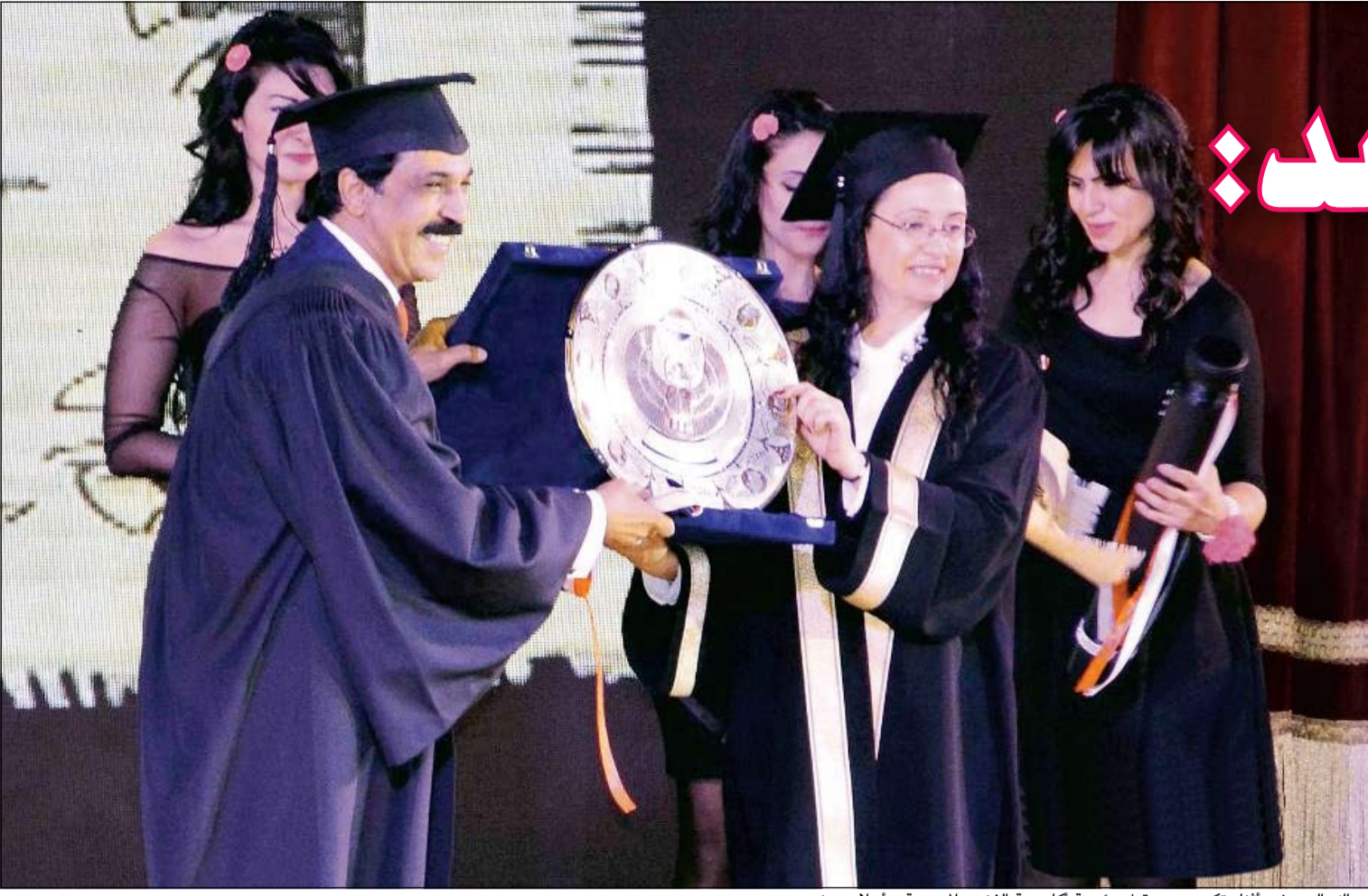
عبدالله الرويشد أثناء تكريمه من قبل رئيسة أكاديمية الفنون المصرية د.احلام يونس