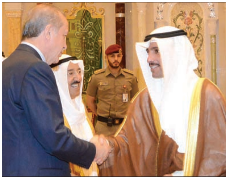
مرزوق الغانم مصافحا الرئيس التركي خلال مأدبة الغداء