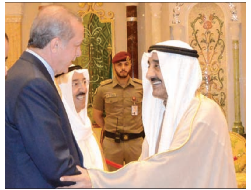
جاسم الخرافي مصافحا الرئيس رجب طيب اردوغان