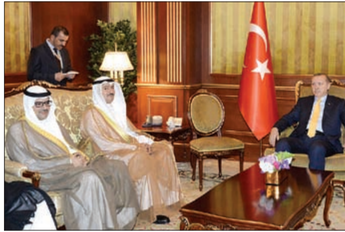
الرئيس التركي رجب طيب اردوغان مستقبلا حمد المرزوق ومازن الناهض