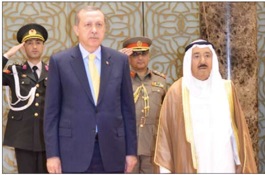
صاحب السمو الامير الشيخ صباح الاحمد والرئيس التركي رجب طيب اردوغان اثناء مراسم الوداع