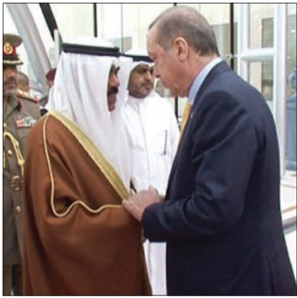
سمو ولي العهد الشيخ نواف الأحمد مصافحا الرئيس التركي لدى مغادرته