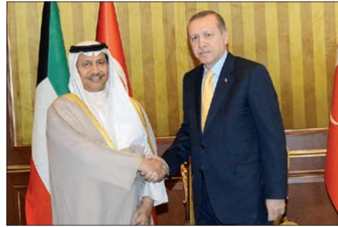
الرئيس التركي رجب طيب اردوغان مستقبلا سمو رئيس الوزراء الشيخ جابر المبارك

الشيخ نواف الأحمد ورئيس مجلس الأمة مرزوق الغانم والشيخ جابر المبارك والنائب الأول لرئيس مجلس الوزراء وزير الخارجية الشيخ صباح الخالد ونائب رئيس مجلس الوزراء وزير الداخلية الشيخ محمد الخالد ونائب وزير شؤون الديوان الأميري الشيخ علي الجراح ونائب رئيس مجلس الوزراء وزير الدفاع الشيخ خالد الجراح وكبار المسؤولين بالدولة وكبار القادة في الجيش والشرطة والحرس الوطني.