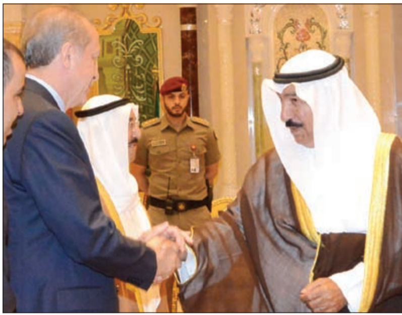
الشيخ جابر العبدالله يصافح الرئيس التركي