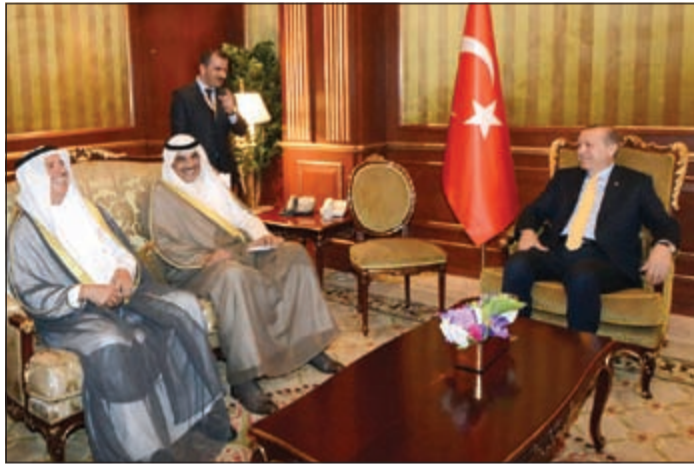
الرئيس التركي مستقبلا الشيخ صباح الخالد ود.يوسف الابراهيم