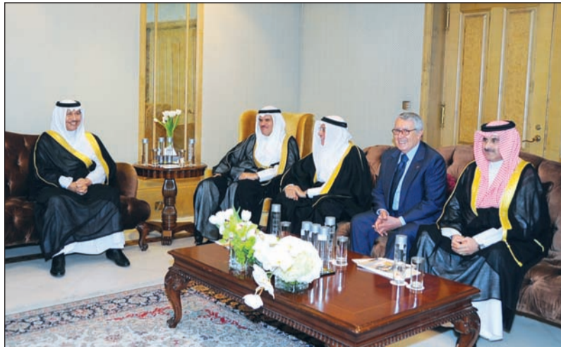
سمو رئيس الوزراء الشيخ جابر المبارك مستقبلا الشيخ سلمان الحمود والشيخ مبارك المنيع ومحمد بن عيسى