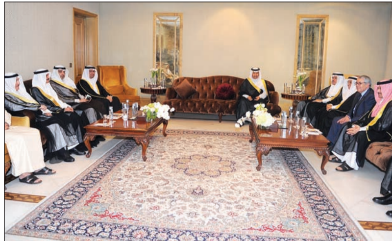
سمو رئيس الوزراء الشيخ جابر المبارك مستقبلا عددا من المشاركين في الملتقى الإعلامي العربي