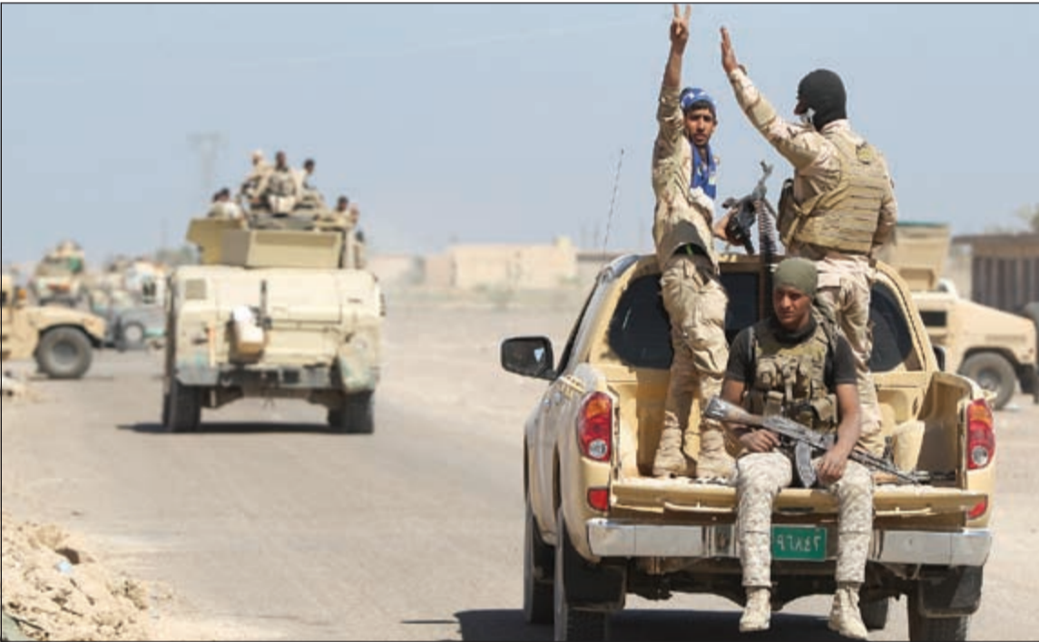
قوات عراقية خلال توجيهها إلى إحدى مناطق محافظة الأنبار لطرد عناصر «داعش» منها أول من أمس

بغداد - وكالات: اتفقت الرئاسات العراقية الثلاث (رئاسة الجمهورية والحكومة والبرلمان) على ضرورة استكمال الاستعدادات اللازمة للنجاح في دحر الإرهاب، ووضع خطط كفيلة بتسليح مقاتلي المناطق التي يسيطر عليها تنظيم «داعش» في محافظتي نينوى والأنبار.