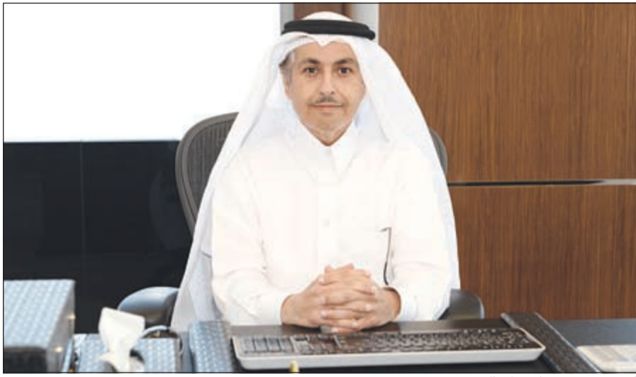
الشيخ سعود بن ناصر آل ثاني

ذكرت شركة «Ooredoo» أن قاعدة عملاء شركة الوطنية للاتصالات «Ooredoo» الكويت بلغت 2,5 مليون عميل في نهاية الربع الأول من سنة 2015 أي زيادة بنسبة 11,1% بالمقارنة بالفترة عينها من العام 2014. وقد بلغت إيرادات الربع الأول من سنة 2015 ما مجموعه 44,3 مليون دينار بارتفاع بنسبة 6% بالمقارنة بالربع الأول من سنة 2014 إذ بلغت الإيرادات 41,8 مليون دينار.