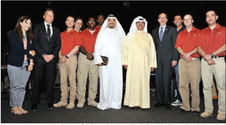
الشيخ فهد المبارك والسفير الأميركي وخالد العجلان مع المشاركين في الحلقة ومقدمي البرنامج