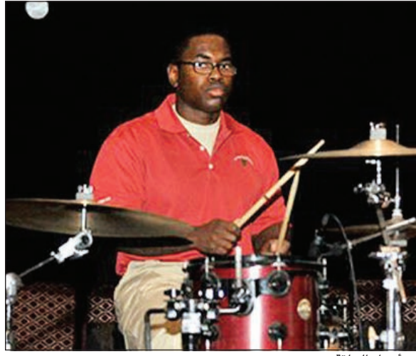
من اجزاء الحلقة