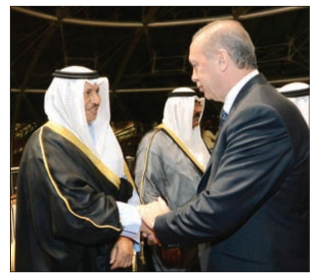
سمو رئيس الوزراء الشيخ جابر المبارك مرحباً بالرئيس أردوغان