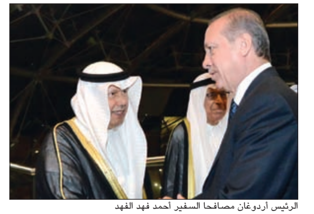
الرئيس أردوغان مصافحاً السفير أحمد فهد الفهد