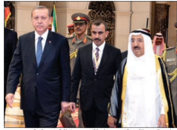
صاحب السمو الأمير الشيخ صباح الأحمد مستقبلاً الرئيس التركي

وصل إلى البلاد مساء أمس الرئيس رجب طيب أردوغان رئيس جمهورية تركيا الصديقة وحرمة السيدة أمينة أردوغان والوفد الرسمي المرافق له في زيارة رسمية للبلاد تستغرق يومين يجري خلالها مباحثات رسمية مع صاحب السمو الأمير الشيخ صباح الأحمد. وكان على رأس مستقبلي الرئيس التركي على أرض المطار صاحب السمو الأمير الشيخ صباح الأحمد وولي العهد الشيخ نواف الأحمد ورئيس مجلس الأمة مرزوق الغانم ونائب رئيس المجلس الوطني الشيخ مشعل الأحمد وسمو الشيخ جابر المبارك رئيس مجلس الوزراء والنائب الأول لرئيس مجلس الوزراء ووزير الخارجية الشيخ صباح الخالد