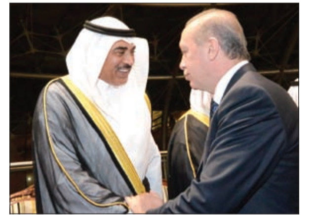
الرئيس التركي مصافحاً الشيخ صباح الخالد