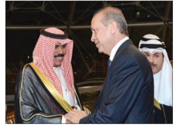
سمو ولي العهد الشيخ نواف الأحمد مرحباً بالرئيس أردوغان