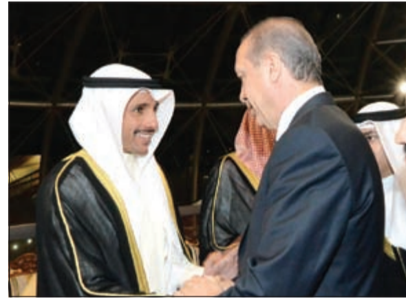
رئيس مجلس الأمة مرزوق الغانم مصافحاً الرئيس التركي