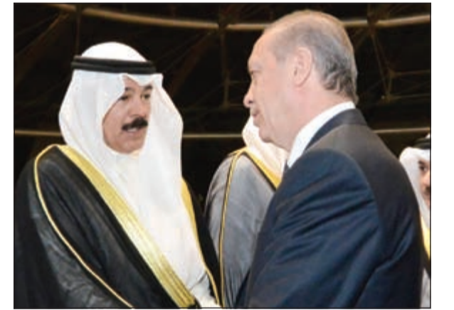
ترحيب بالرئيس التركي من الشيخ محمد الخالد