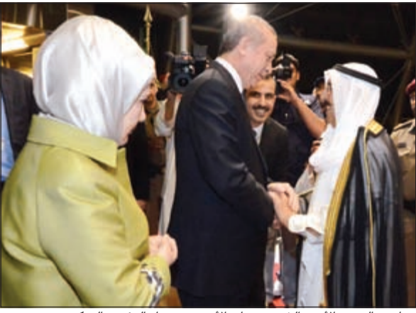
صاحب السمو الأمير الشيخ صباح الأحمد مرحباً بالرئيس التركي وحرمة