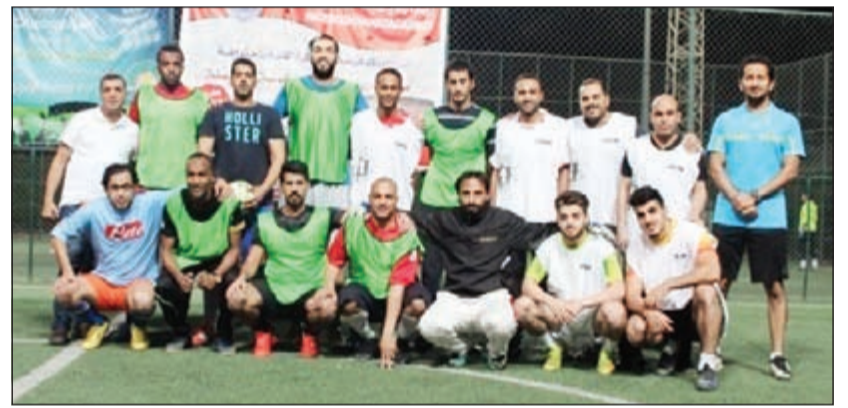
فريق «الأنباء» المشارك في البطولة

بين الفريقين بنتيجة 2-2. وفي المباراة الأخيرة التي جمعت بين «الأنباء» و«القيس» الوردية ومجلة «بريق» فازت «القيس» بضرربات الترجيح 5-4 بعد تعادل الفريقين بالوقت الأصلي 2-2. هذا وتبدأ مباريات الدور الثاني مساء اليوم الاثنين بمباراة تجمع بين فريقين جريدين «القيس» الإلكتروني و«جريدة أكاديميا الإلكترونية»، والمباراة الثانية بين فريقين جريدين «الجريدة» و«جريدة القيس» الوردية، والمباراة الثالثة تجمع بين فريقين جريدين «الشاهد» و«جريدة الأنباء» بضرربات الترجيح 2-1 بعد التعادل