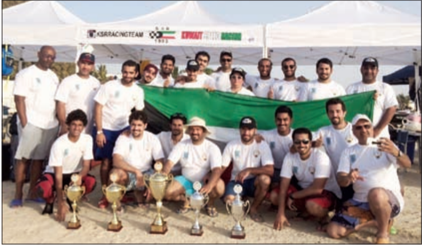
فريق كي أس آر مع الكؤوس

حقق متسابقو فريق «كي أس آر» الكويتي لقبين في ختام الجولة السادسة لموسم الإمارات للدراجات المائية لعام 2015 في فئتي الستوك للمحترفين والستوك للهواة.