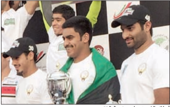
أبطال الفريق على منصة التتويج