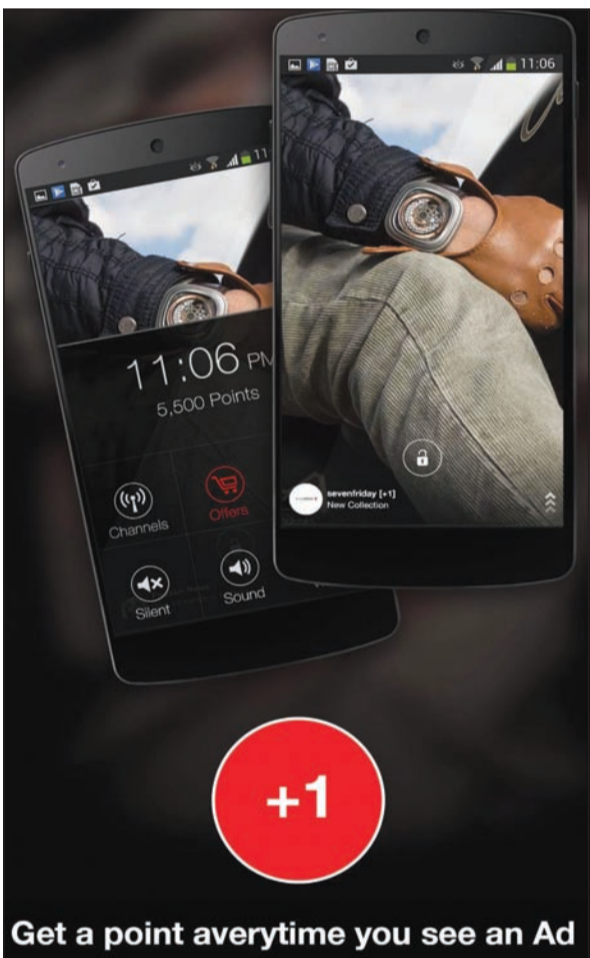
Get a point everytime you see an Ad

● جميع المشاركين كان لديهم مؤهلات ومواهب ومهارات لكن أن تختلط برواد التكنولوجيا فهذا يعني كسب العديد من المهارات والخبرات وتطويرها.