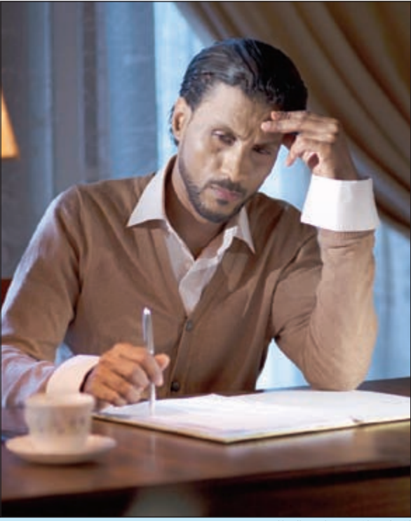
الممثل والمنتج جاسم البطاشي