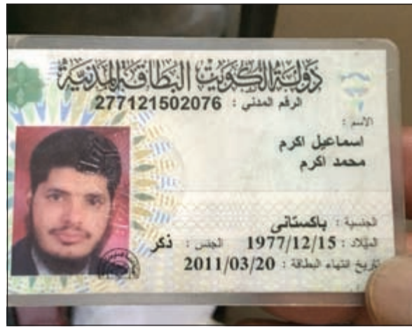
القاتل مخالف لقانون الإقامة منذ 2011