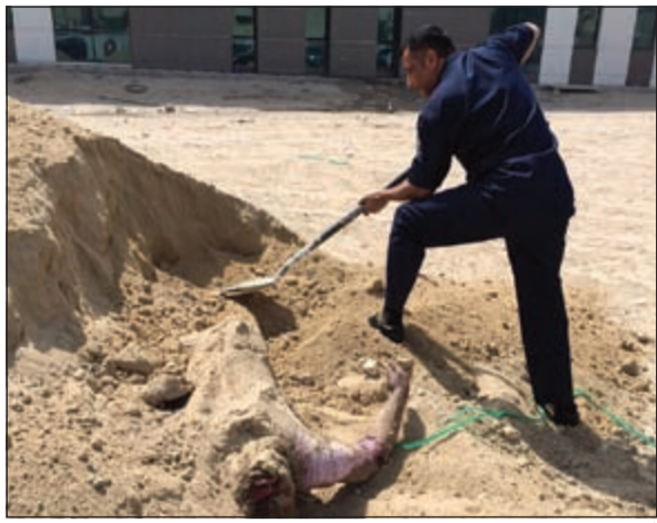
أحد رجال الألة الجنائية يزيح الرمال عن جثة الوافد في السرة