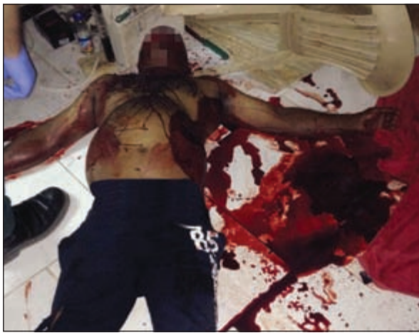
الخمر والقمار وراء جريمة الجليب