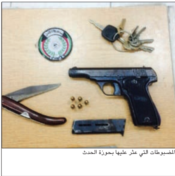
المضبوطات التي عثر عليها بحوزة الحدث

كلف رجال إدارة بحث وتحري محافظة الاحمدي بالبحث عن شخصين مجهولين