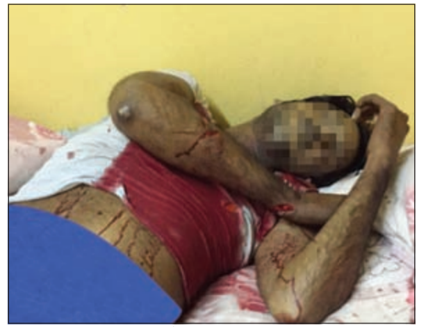
جثة الباكستاني حيث باغته زميله وهو نائما وأرداه قتيلا

في يوم دموي شهد 3 جرائم قتل راح ضحيتها 4 وافدين