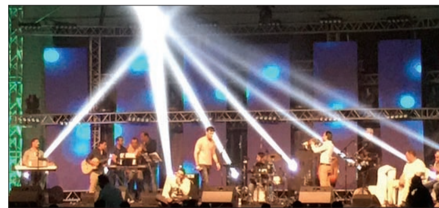
من اجواء الحفل في سناد النادي العربي

وفي ظل سعيهم لكسر الأجواء التقليدية للحفلات الغنائية، قدم فهمي مسابقة للحضور بالتعاون مع نادر الذي تولى عزف مقدمات بعض الأغنيات وجاءت الإجابة من الجمهور ومضت الفرقة في أمسياتها الكرنفالية مقدمة أغنية «ده كلام» الرومانسية ومنها إلى «ليل وشوق ونجوم» التي جانب أغنية «يا غالي عليا» التي اطلقتها الفرقة عام 2010 وكان التنوع سمة سائدة في أغنية «حبها جوا القلب»، ثم بأغنية «هيه دموع ولا أكثر» وجاءت «زي ما يحلم بيك» لتخرج الفرقة بأشهر أغنيات المطربة داليدا «حلوة يا بلدي» التي أثارت عبق الماضي وعلت معها الأصوات.