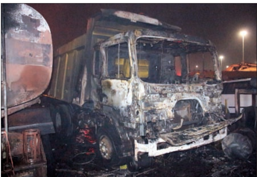
الحريق تسبب بتفجيات كبيرة