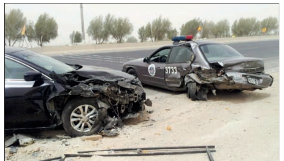
آثار الاصطدام العنيف على الدورية وتبدو سيارة السيدة