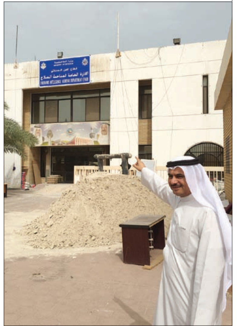
اللواء فراج الزعبي امام المبني الجديد للإدارة العامة لمباحث السلاح

كشفت مدير عام الإدارة العامة لمباحث السلاح اللواء فراج الزعبي عن أن إجمالي الأشخاص الذين بحوزتهم رخص سلاح صالحة في عموم البلاد يبلغ 28 ألف شخص، مؤكدا أن هناك ضوابط للحصول على رخصة السلاح أهمها أن يكون طالب الرخصة يتجاوز الـ 21 عاما، وألا تكون عليه قضايا جنائية، ويكون لائقا صحيا، مؤكدا على أهمية وزارة الداخلية في سحب التراخيص متى ما أخل بأي من الاشتراطات المحددة والتي بموجبها استصدر تصريحها بحيازة سلاح ناري. وقال اللواء فراج الزعبي إن هناك ترتيبات ستري النور قريبا بشأن ربط آلي بين المحلات المختصة ببيع الأسلحة والذخيرة الكترونيا بالإدارة العامة لمباحث السلاح، بحيث يكون لدى الإدارة كامل البيانات بشأن الأسلحة والذخيرة الموجودة في هذه المحلات ومتى ما تم بيع ذخيرة وسلاح لأي شخص يكون لدى «الداخلية» كامل بيانات الشخص، على أن يأتي لأخذ رخصة من الإدارة ودفتري. وأعلن اللواء الزعبي عن أن وزارة الداخلية قامت أخيرا بإحالة 3 محلات لبيع السلاح من أصل 16 محلا مخصصا لهذا الغرض إلى النيابة بعد أن ثبت وجود خلل بين