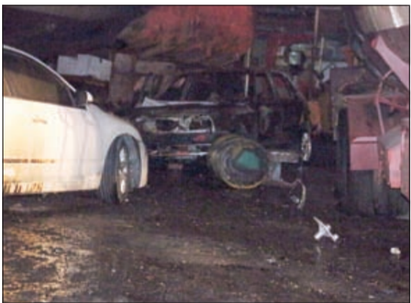
أثار الحريق بداخل احد الكراجات

أصيب ثلاثة أشخاص أحدهم حالته حرجة للغاية، وذلك بعد اندلاع حريق أتى على 3 كراجات بمنطقة الفحيحيل الصناعية مساء أول من أمس، ووفق مصدر إطفائي فإن بلاغا ورد إلى غرفة عمليات الإطفاء عن البلاغ وتوجهت على الفور فرقة مراكز الفحيحيل وميناء عبدالله والإسناد إلى موقع البلاغ، حيث تبين أن حريقا هائلا اندلع في كراج بمنطقة الفحيحيل الصناعية وسرعان ما امتدت النيران لتلتهم كراجين آخرين وحدث انفجار في أحد الصهاريج المتوقفة بأحد الكراجات المحترقة ليصيب 3 أشخاص، آسيويين وعربيا فيما وصفت حالة أحدهم بالحرجة، وتمكن رجال الإطفاء من السيطرة على الحريق وإخماده في