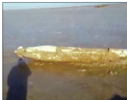
الصاروخ قبل أن يقوم رجال خفر السواحل بالتعامل معه