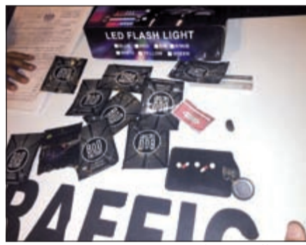
المضبوطات بحوزة المتهمين