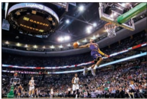
ارتقاء رائع من «الملك» لبيرون جيمس

أصبحت اندية غولدن ستايت ووريرز وكليفاند كافاليرز وشيكاغو بولز على بعد فوز واحد من التأهل الى الدور الثاني من البلاي أوف في دوري كرة السلة الأميركي للمحترفين بعد تحقيق فوزها الثالث على التوالي على نيو اورليانز بيليكانز وبوسطن سلتيكس وميلووكي باكس. في المنطقة الغربية، تقدم غولدن ستايت ووريرز متصدر ترتيب الدور المنتظم على نيو اورليانز بيليكانز 3-0 بفوزه عليه في عقر داره 123-119 بعد التمديد على ملعب «سموثي كينغ سنتر» امام 18444 متفرجا. ويتأهل الى الدور الثاني الفريق الذي يسبق منافسه الى الفوز في 4 من 7 مباريات، وبالتالي سيكون غولدن ستايت قادرا على خطف بطاقة التأهل في المباراة الرابعة غدا السبت على ارض خصمه. والافت ان غولدن ستايت قلب تخلفه بفارق عشرين نقطة في الربع الاخير فارضا وقتسا إضافيا بفضل ثلاثية خارقة من نجمه المرشح لجائزة افضل لاعب هذا الموسم ستيفن كوري قبل 8. 2 ثانية على انتهاء الوقت الأصلي ومن وضعية صعبة جدا. وفي المنطقة الشرقية، قاد «الملك» لبيرون جيمس كليفاند كافاليرز الى فوز ثالث على بوسطن سلتيكس 103-97 فسي عقر داره ملعب «تسي دي غارن» امام 18624 متفرجا. وسجل جيمس 31 نقطة و11 متباعدة و4 سرقات و4 تمريرات حاسمة لكليفاند المصنف الثاني في الشرقية، فعلق بعد الفوز: «أحب القيام بكل شيء تقريبا، وأريد ان اكون جزءا بكل ما يفعله فريقي». وقدم الموزع ديريك روجن مباراة كبيرة عندما سجل 34 نقطة وهو أعلى رصيد له هذا الموسم، فقاد شيكاغو بولز الى فوز ثالث على التوالي على مضيفه ميلووكي باكس (6) 113-106 بعد التمديد مرتين على ملعب «بي ام او هاريس برادلي سنتر» امام 18717 متفرجا. ويلتقي الفائز من سلسلة كليفاند مع الفائز من سلسلة شيكاغو وهو أمر مرجح بعد تقدمهما بثلاثية نظيفة.