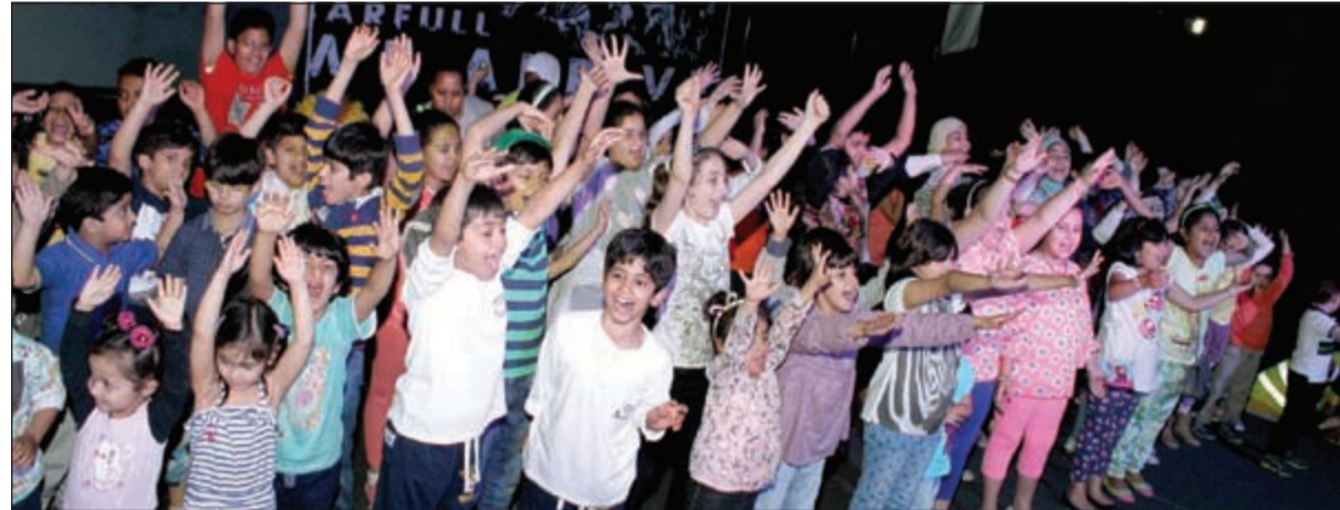
مشاركة من الاطفال