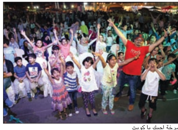
صرخة احبك يا كويت