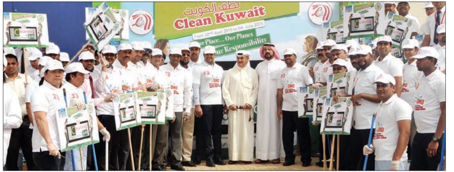
فريق «لو أند لو» المشارك بحملة التنظيف

وكانت المملكة العربية السعودية أكبر أسواق المنطقة في حجم المبيعات، حيث بلغت 4,1 مليارات دولار خلال العام، بينما تصدرت الإمارات القائمة من حيث أعلى قيمة إنفاق للفرد الواحد، بلغت 156 دولاراً للشخص الواحد.