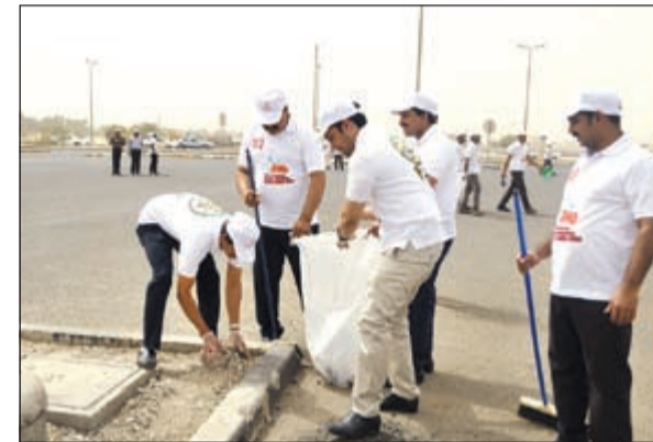
جانب من حملة النظافة

ومن خلال تعظيم الأثر الإيجابي «لحملة التنظيف»، يهدف هايبر ماركت لواند لو إلى تطبيق فلسفة الشركة حول مسؤولية المجتمع.