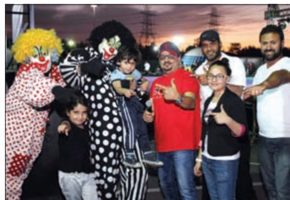
فرقة مصفلي النجار