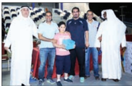
توزيع الجوائز للفائزين

أسفرت نتائج منافسات اليوم الرابع لبطولة نقابة العاملين بشركة نفط الكويت الثالثة لكرة القدم، عن فوز النواخذة على فريق التصدير 1-2، وتغلب فريق عركوش على فريق العمجي 3-0، فيما تمكن فريق شركة نفط الكويت «ج» من اجتياز عقبة الحفر العمجي بركلات الترجيح 4-3. إلى ذلك سيلتقي مساء اليوم كل من فريق النفط «د» مع أطراف المقوع واحمد الشمري مع إداريي المشاريع والشوارع غرب مع النواخذة.