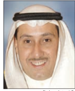
الشيخ فيصل الحمود

أكد محافظ الفروانية الشيخ فيصل الحمود أن مشكلة سكن العزاب في مناطق السكن الخاص والنموذجي باتت هاجساً يؤرق المواطنين في جميع المناطق لما لها من آثار اجتماعية وأمنية، وذلك الأمر يتطلب تضافر الجهود الرسمية والمجتمعية واتخاذ كل الإجراءات التي من شأنها القضاء على هذه المشكلة من جذورها. وقال الحمود في تصريح خاص لـ «الأنباء» أخذنا على عاتقنا منذ فترة طويلة القضاء على ظاهرة العزاب بجميع مناطق المحافظة والتي على أثرها التقينا بوزير الدولة لشؤون البلدية عيسى