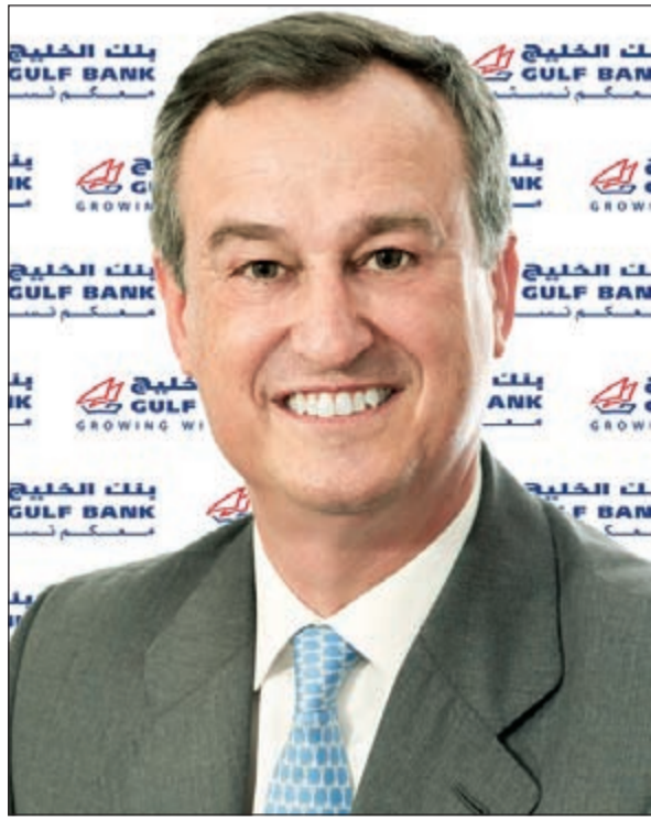
سيزار جونزاليس بويينو

الإطار المستخدم في قياس أداء كل من مجموعات العمل على حدة، بينما نواصل العمل على تعزيز تجربة عملائنا من خلال الابتكار. وبيدوره، صرح الرئيس التنفيذي لبنك الخليج سيزار جونزاليس بويينو، قائلاً: «يسرني أن أعلن عن تحقيق البنك لهذه النتائج الإيجابية في الربع الأول من العام. حيث تعكس هذه النتائج ما قدمه موظفو بنك الخليج كافة من جهود مخلصه ومتواصلة. فقد حصل مصرفنا مؤخراً على جائزة «أفضل بنك للخدمات المصرفية للأفراد في الكويت» من مجلة آسيان بانك، للمرة الرابعة على التوالي. كما فاز بنك الخليج بجائزة «أفضل تجربة للعملاء على مستوى الفرع الشامل في الكويت» من شركة إيغوس للحلول المتكاملة، وجائزة «أفضل خدمة عملاء للأفراد» من بانكر ميدل إيست». وأضاف: «وتتضمن خطط البنك للمرحلة المقبلة التزام كل من مجموعة الخدمات