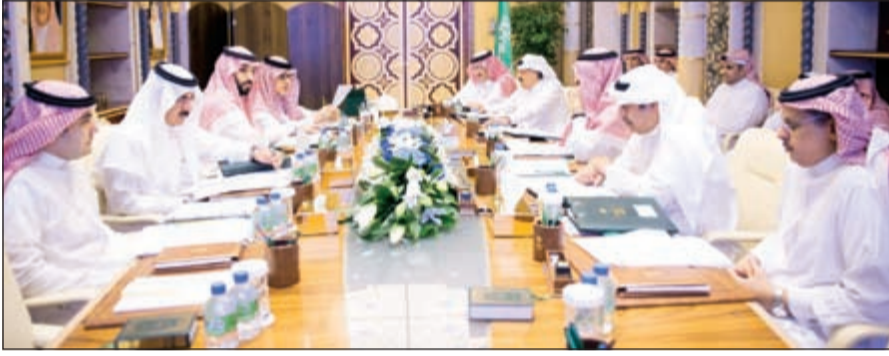
مجلس الشؤون السياسية والأمنية السعودي خلال اجتماعه برئاسة ولي ولي العهد صاحب السمو الملكي الأمير محمد بن نايف بحضور أصحاب السمو الملكي الأمير سعود الفيصل والأمير متعب بن عبدالله والأمير محمد بن سلمان

إلى ذلك، أعلن وزير الحرس الوطني السعودي الأمير متعب بن عبدالله، أن خادم الحرمين الشريفين الملك سلمان بن عبدالعزيز أمر بمشاركة قوات الحرس الوطني في العمليات التي تقودها المملكة ضد المتطرفين الحوثيين في اليمن. التفاصيل ص 43