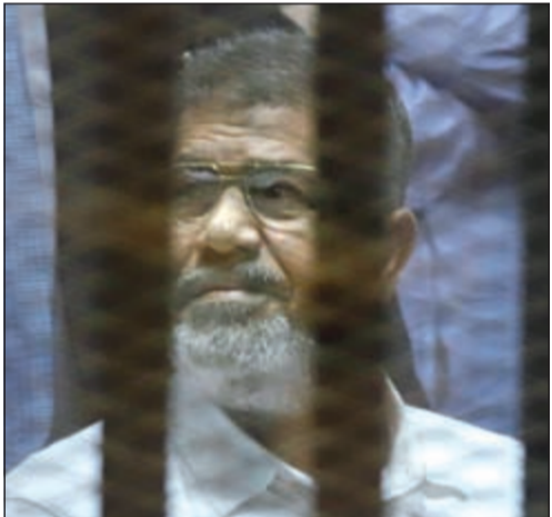
محمد مرسي في القفص خلال المحاكمة أمس

القاهرة - وكالات: في أول حكم من أصل خمس قضايا، أصدرت محكمة جنايات شمال القاهرة أمس حكماً بالسجن 20 عاماً بحق الرئيس المصري المعزول محمد مرسي و12 آخرين من قيادات جماعة الإخوان المسلمين بتهم «استعراض القوة والعنف واحتجاز وتعذيب معارضين لهم» في القضية المعروفة إعلامياً باسم «أحداث الاتحادية» مع تبرئته من تهمة التحريض على قتلهم. وقال مصدر أمني إن أول تعليق لمرسي كان عندما دخل عليه مسؤولو السجن، ليسلموه البدلة الزرقاء المخصصة للسجناء المحكوم عليهم، حيث صاح قائلاً: «البدلة الزرقاء.. إزاي؟! أنا الرئيس الشرعي.. أنا حمشيكم كلكن من الخدمة... وحاعرف أحاسبكم إزاي». التفاصيل ص 41