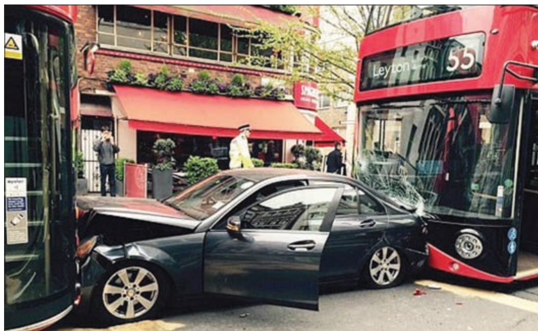
المرسيدس محاصرة ومحطمة بين الحافلتين

وتوقفت الحافلة فجأة فاصطدمت سيارة مرسيدس بالحافلة من الخلف، لتأتي الحافلة الأخرى وتضغط المرسيدس، التي تحولت إلى ساندويتش بين الحافلتين.