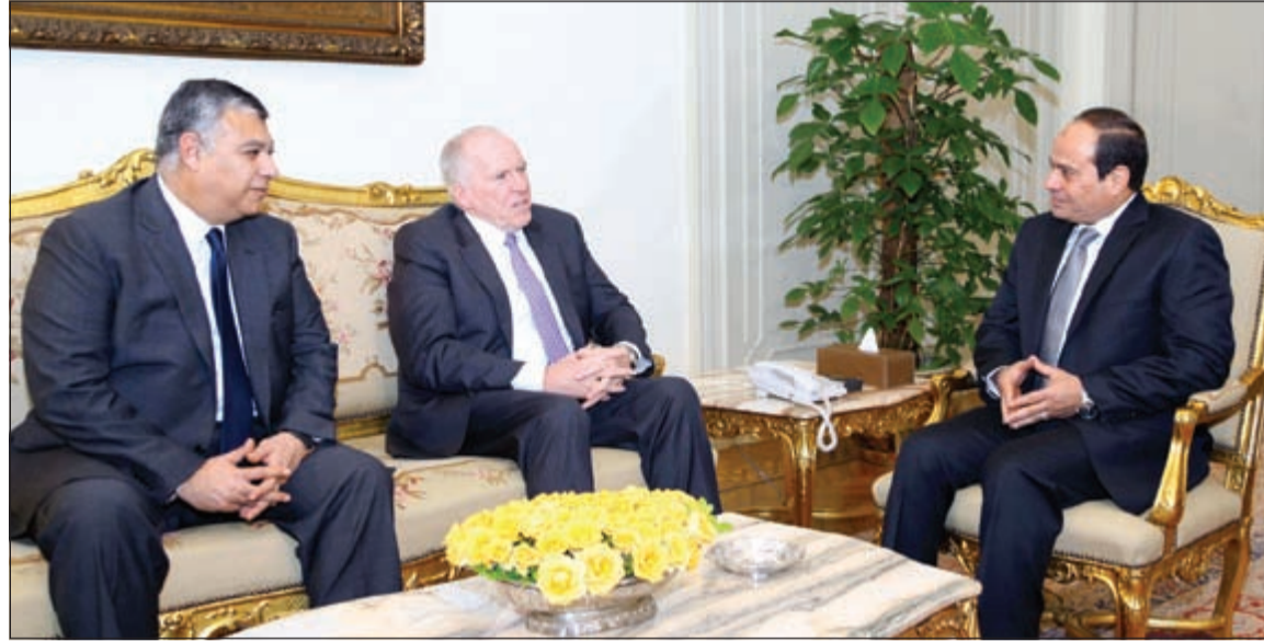
الرئيس المصري عبدالفتاح السيسي خلال لقائه مدير «سي أي إيه» جون بريان بحضور مدير المخابرات العامة خالد فوزي في القاهرة أمس الأول

الذي يزور مصر على رأس وفد رفيع المستوى. وتناول اللقاء تطورات الأوضاع بالمنطقة والتغيرات على الساحتين الإقليمية والدولية وانعكاسها على الأمن والاستقرار بالشرق الأوسط وسبل تعزيز التعاون والعلاقات العسكرية بين القوات المسلحة لكلا البلدين، كما بحث الجانبان أوجه التعاون في المجالات العسكرية والتدريبية المشتركة.