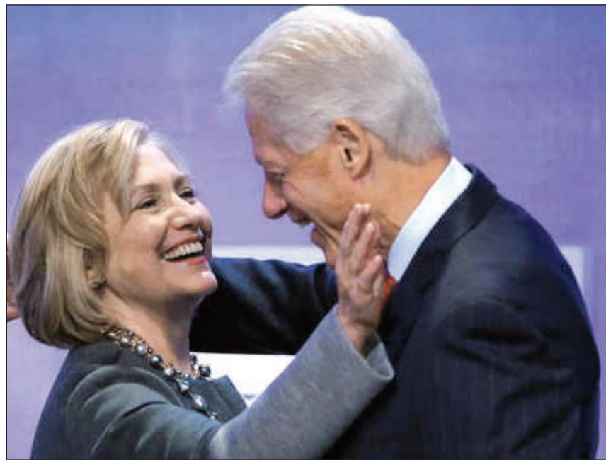
صورة لبيل وهيلاري كلينتون في سبتمبر 2014

القاهرة - وكالات: أعلن المتحدث العسكري باسم القوات المسلحة المصرية العميد محمد سمير مقتل ضابط وجنديين وإصابة جندي آخر أثناء ملاحقتهم المهربين والعناصر الإجرامية على خط الحدود الدولية في شمال سيناء أمس. ونقلت وكالة أنباء الشرق الأوسط الرسمية عن المتحدث العسكري قوله إن الحادث وقع عندما «قامت العناصر الإرهابية