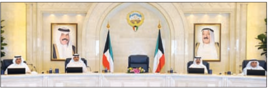
الشيخ صباح الخالد مترشداً جلسة أمس وبيدو الشيخ محمد الخالد والشيخ خالد الجراح والشيخ سلمان الحمود

تصحح هذه الاختلالات وإعادة التوازن لصالح المكون الوطني في التركيبة السكانية وكل ما من شأنه الحفاظ على مقدرات الوطن وهويته الثقافية. وقد قرر المجلس إحالة التقرير إلى اللجنة الوزارية للشؤون التعليمية والاجتماعية والصحية لاستكمال إعداد الآليات العملية اللازمة لتفعيل توصيات التقرير ومقرحاته.