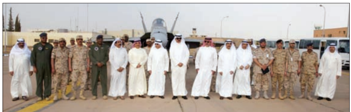
الشيخ محمد الخالد والشيخ خالد الجراح خلال تفقدتهما القوة المشاركة في «عاصفة الحزم»

تعد مبعث فخر واعتزاز لكل مواطن كويتي، كما أشادوا باليقظة والاستعداد والتأهب النام للقيام بالهامم العسكرية بنفس الكفاءة والافتقار والروح القتالية العالية التي يتمتع بها جميع عناصر القوة للدفاع عن أمن وسلامة واستقرار دول مجلس التعاون لدول الخليج العربية.