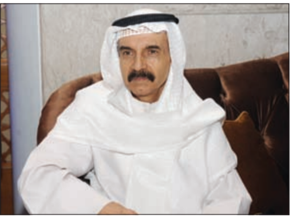
المستشار فيصل المرشد

القضائية ليلتحقوا بالتدريب والتأهيل المناسبين لمدة سنة، ويتم ابتعاث العشرة الاوائل من هؤلاء الخريجين الى بريطانيا لدراسة اللغة الانجليزية والمصطلحات القانونية والقضائية. ووضح المستشار المرشد ان تعيين الاناث في النيابة العامة قد تم ابقائه لبعض سنوات لحين تقييم التجربة الحالية وقطف ثمارها، فقد تم تعيين 22 من الاناث في النيابة العامة بعد ان حلفن اليمين منذ حوالي شهرين.