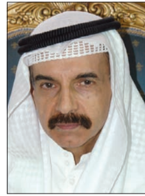
المستشار فيصل المرشد

بالتفوق الواضح، مؤكداً أنه سيقن الرجال في الدراسة بمعهد الكويت للدراسات القضائية. التفاصيل ص 3