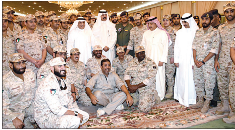
الشيخ محمد الخالد والشيخ خالد الجراح خلال تفقدهما القوة المشاركة في عاصفة الحزم

الغانم في جلسة برلمان الطالب: نحن هنا جميعاً لنستمع إلى آرائكم ومشاكلكم وهمومكم وتطلعاتكم 12