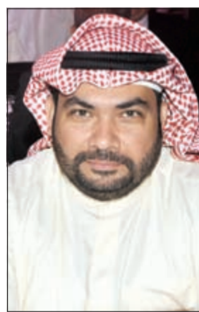
الفنان عصام الكاظمي