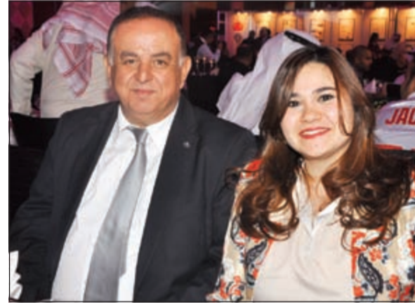
عماد ملاعب وافراح برو