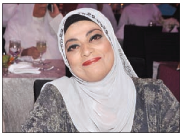
الفنانة هدى حمادة