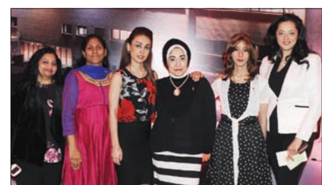
جانب من الزميلات في «الأنباء»