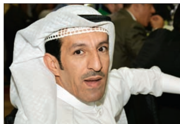
الفنان ابو هلال