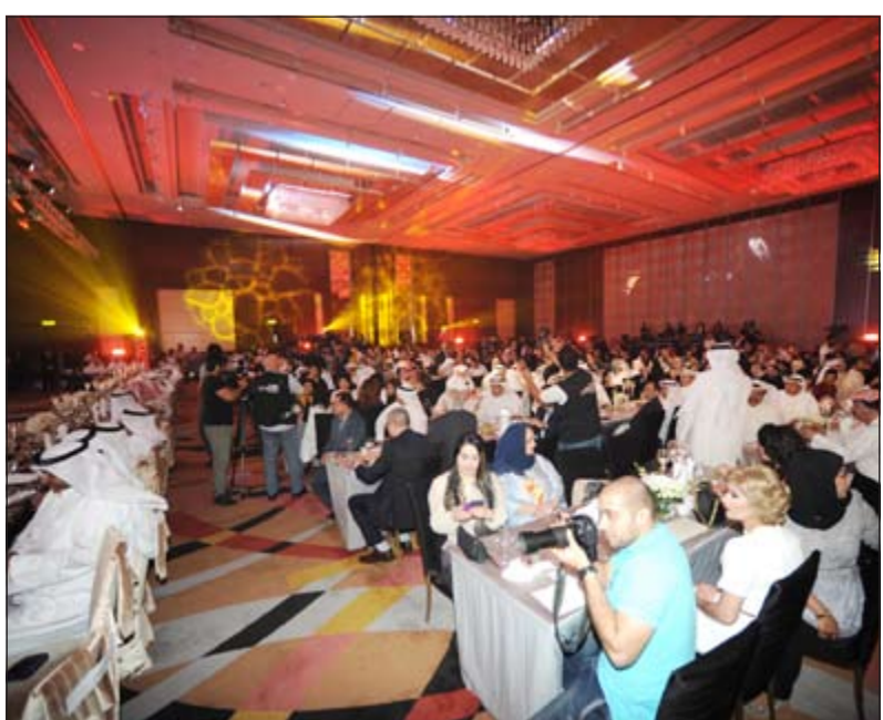
حضور حاشد في الحفل