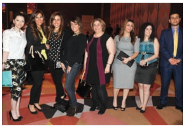
إبتسامة كاميرا «الانباء»