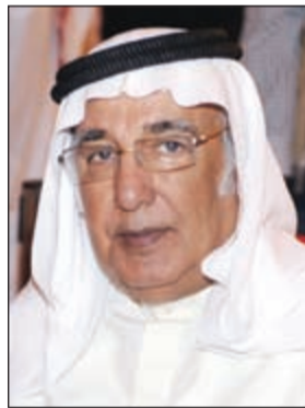
الشاعر عبداللطيف البناي