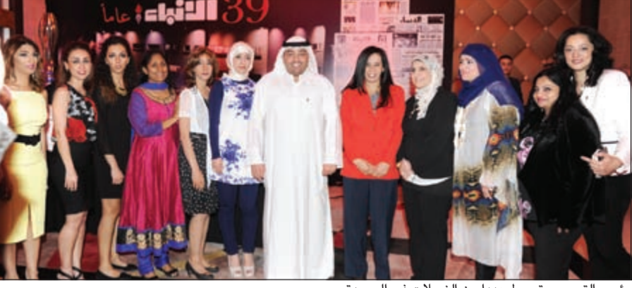
رئيس التحرير يتوسط عددا من الزميلات في الجريدة