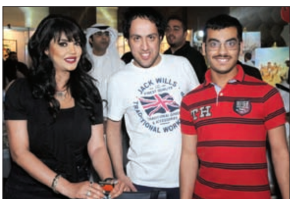
جواهر مع اثنين من معجبيها