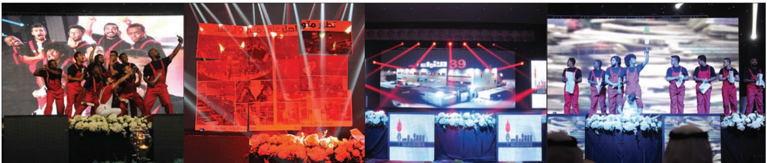
لوحات من العرض الخاص الذي قدمته مجموعة من الشباب بالمناسبة