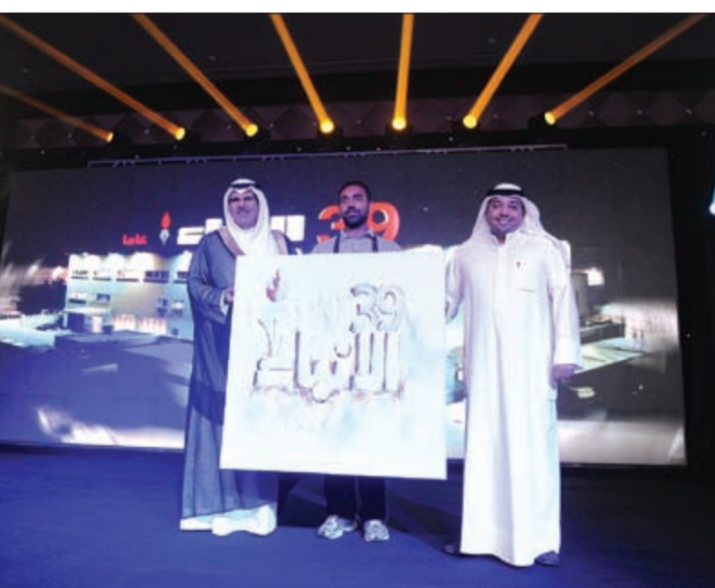
هدية تذكارية مقدمة من «الأخبار» إلى وزير الإعلام وهي لوحة بريشة الرسام أحمد دشتي