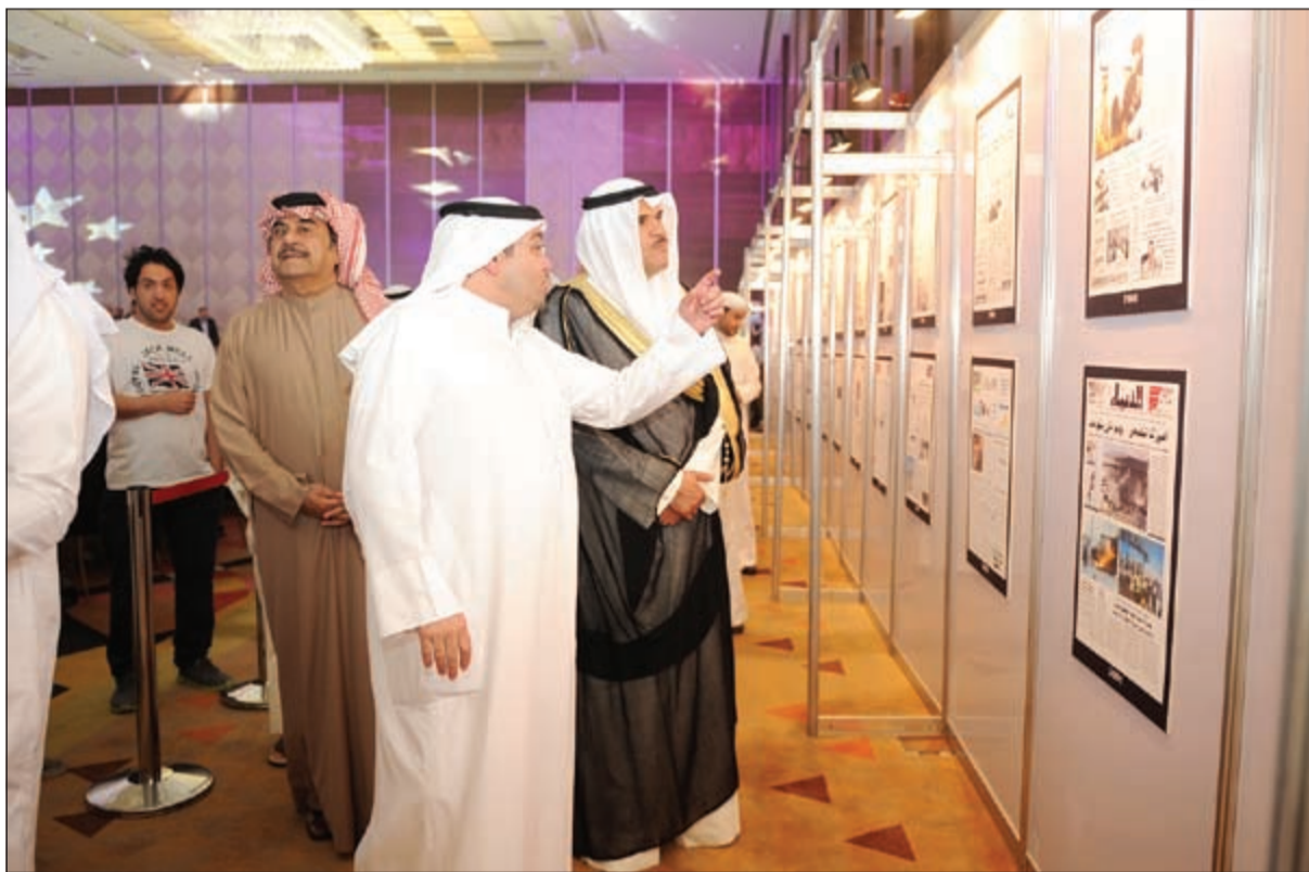
الزميل يوسف خالد المرزوق يقدم شرحا للوزير الشيخ سلمان الحمد عن بعض الصور التي تحمل مانشيتات من تاريخ «الأخبار»