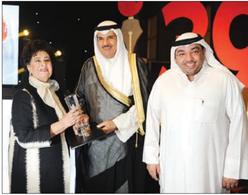
تكريم «ماما أنيسة»