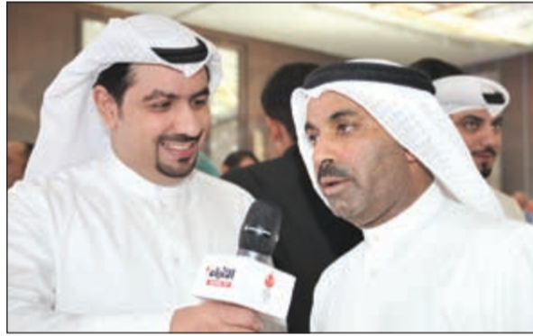
الفنان طارق العلي متحدثا لـ «الأنباء»