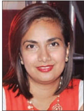
ابتسامة لـ «الأنباء»