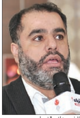
المخرج هاني النصار