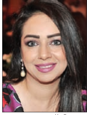
وجه من الحفل