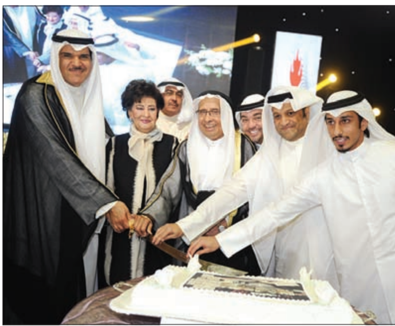
قص كيكة المناسبة

احتفلت بعيدها الـ 39 بحضور حشد كبير من الشخصيات وأهل الإعلام