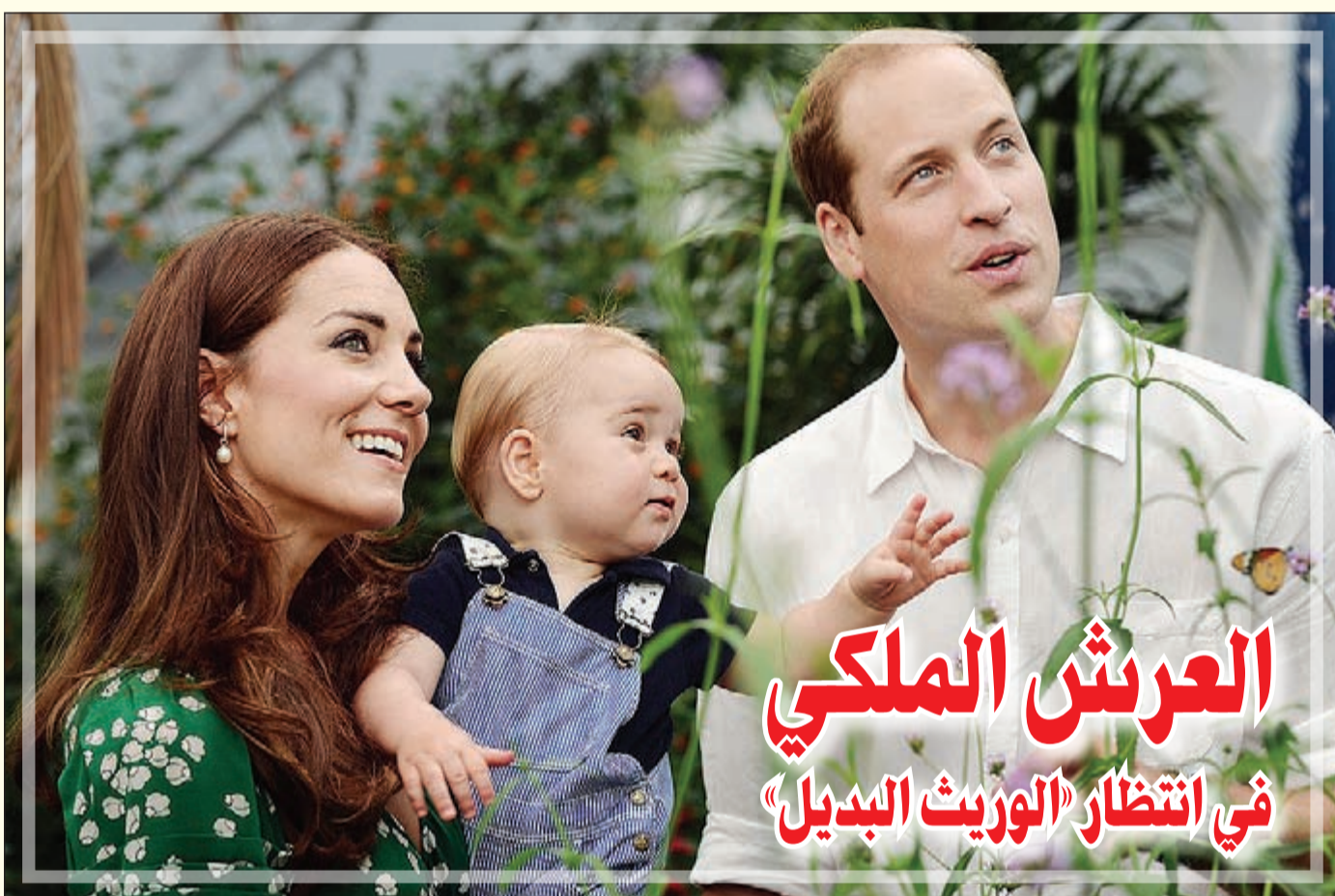
الأمير وليام وكيت وطفلهما الأول

لندن - وكالات: حذرت دراسة بريطانية حديثة من أن عدم شرب ما يكفي من الماء أثناء قيادة السيارات له نفس تأثير القيادة تحت تأثير الكحول من حيث مضاعفة أخطاء القيادة وزيادة نسبة حوادث السير. الدراسة التي قادها باحثون من جامعة «لوفبرا» البريطانية، أوضحت أن دراستهم هي الأولى من نوعها التي ترصد أخطار عدم شرب المياه أثناء القيادة، والتي يمكن أن تؤدي إلى الإصابة بضعف الأداء العقلي، والتغيرات في المزاج، وانخفاض التركيز واليقظة وانخفاض قدرات الذاكرة على المدى القصير بسبب الجفاف. وأوضح الباحثون في دراستهم التي نشرت نتائجها في مجلة «علم وظائف الأعضاء والسلوك»، أن عدم شرب ما يكفي من المياه يعطي نفس تأثير الكحول أثناء القيادة من ضعف الإدراك وانخفاض التركيز، ويزيد من الأخطاء التي تقود إلى وقوع حوادث الطرق بمعدل الضعف، حسب مراسل الأناضول. وحذر الباحثون أيضا من أن القيادة في سيارة ساخنة، وخاصة خلال فصل الصيف، قد تؤدي إلى خسائر نسبة كبيرة من المياه في الجسم طوال فترة الرحلة، وأن هذه الآثار قد تتفاقم عند الأشخاص الذين لا يشربون كمية كبيرة من السوائل عمدا، لتجنب دخول المراهض خاصة في الرحلات الطويلة. وكشفت الدراسة أن السائقين الذين يشربون نحو 25 ملليترا من المياه كل ساعة قيادة فقط يرتكبون ضعف الأخطاء التي يفعلها من يشربون نحو 200 ملليتر من المياه في الساعة. وللوصول إلى نتائج الدراسة، قام الباحثون بإجراء سلسلة من الاختبارات على مدى يومين على عدد من السائقين الذكور، باستخدام جهاز محاكاة القيادة، وتضمنت الاختبارات محاكاة