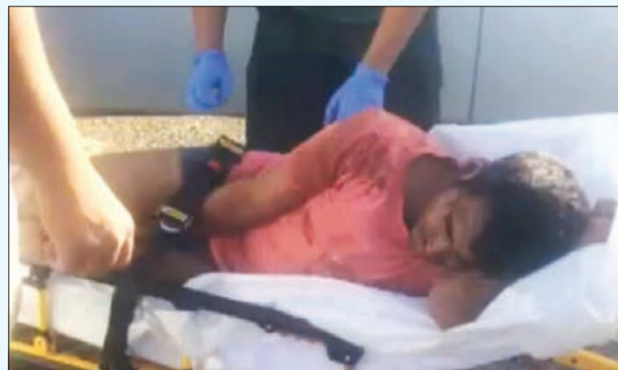
الوافد البنغالي أثناء نقله إلى مستشفى الجهراء وتبدو الدماء تسيل من كتفه