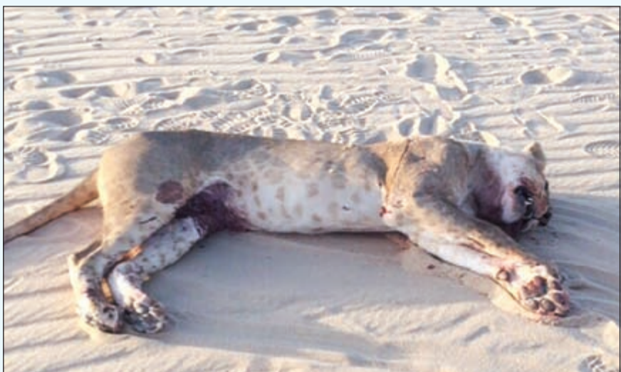
البؤة بعد أن أرداها رجال الأمن