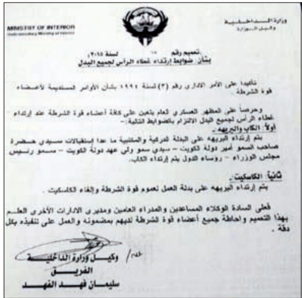
صورة زكروغرافية للتعميم الصادر عن وكيل الوزارة

المدعي عليه ووجهت اليه أسئلة تعلقت بتحريات بأنه غادر البلاد بسيارة شقيقه وبهوية محقق، حيث قال ان المحقق زميل له وأنه غادر البلاد فعلا ولكنه لا يعلم لماذا لم يدرج اسمه في قوائم المغادرين، وبمواجهته بأن زميله المحقق ورغم انه كان متواجدا داخل البلاد ومع