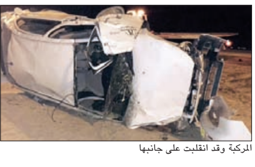
المركبة وقد انقلبت على جانبها