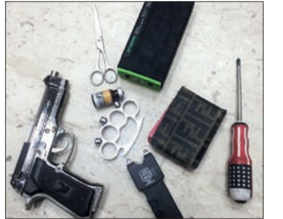
المضبوطات أحيلت إلى جهات الاختصاص