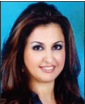
الحامية حنان الصباح

ألغت محكمة الاستئناف برئاسة المستشار عبدالرحمن الدارمي حكما بحبس متهم بجلب مواد مخدرة بقصد الاتجار. وتتلخص الواقعة في أنه عند تفتيش احد القادمين عبر مطار الكويت الدولي تم العثور على كيلو ومائة غرام من مادة الماريغوانا المخدرة مخبأة بحذاء ملفوف بكيس نايلون داخل أمتعة المتهم.