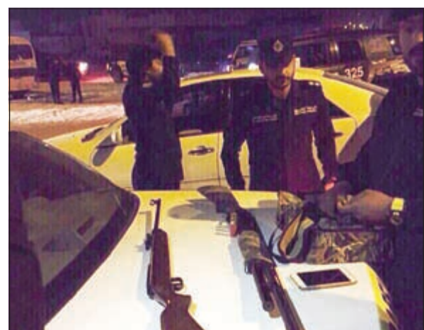
أسلحة حصاد أمن الفروانية