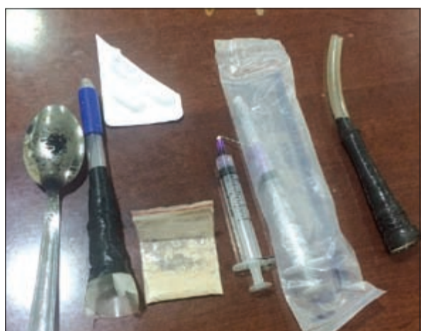
المضبوطات التي كشفت عنها اللوحة الامامية