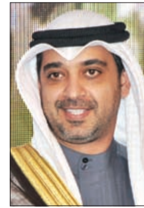
الشيخ محمد العبد الله