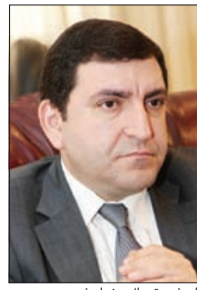
السفير توراتل رضاييف

ومن جهته ارسل محافظ مبارك الكبير الفريق احمد الرجيب رسالة تهنئة وجهها إلى رئاسة التحرير جاء فيها: