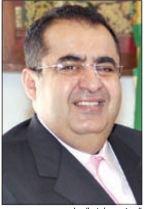
السفير عادل العيار