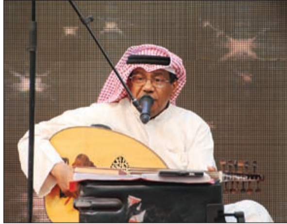
فقره غنائية للمطرب أحمد الخميس