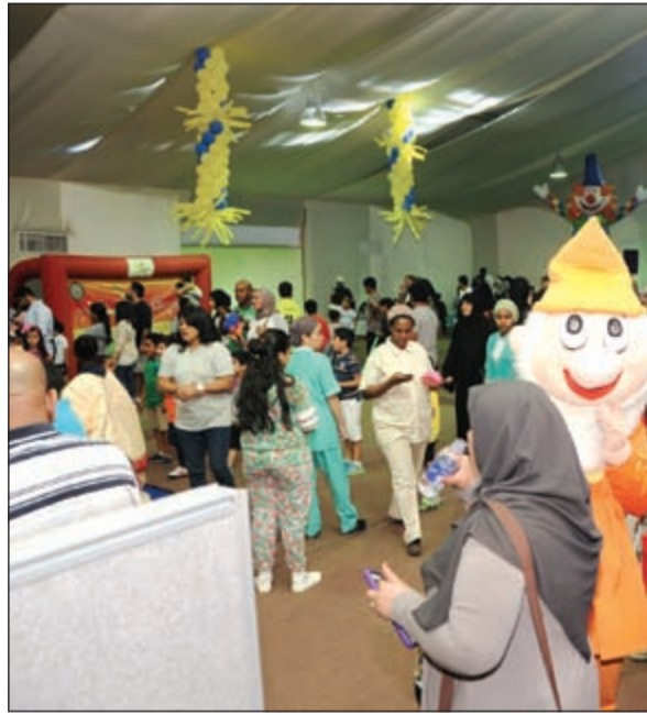
وقت ممتع للأطفال في صالة الألعاب المخصصة

دعت جميع أبناء الكويت إلى زيارة المدينة والاطلاع على مرافقها، فهي حقيقة وجهة سياحية تستحوذ على