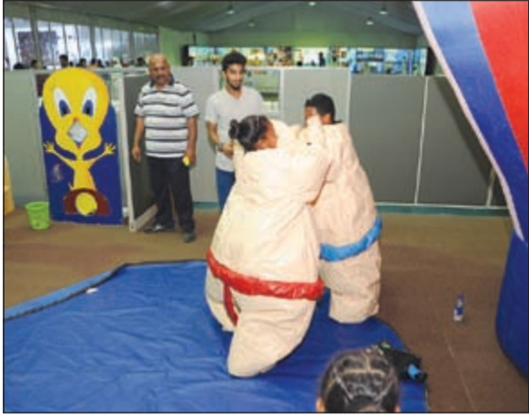
فرح وممتعة ولعاب مميزة