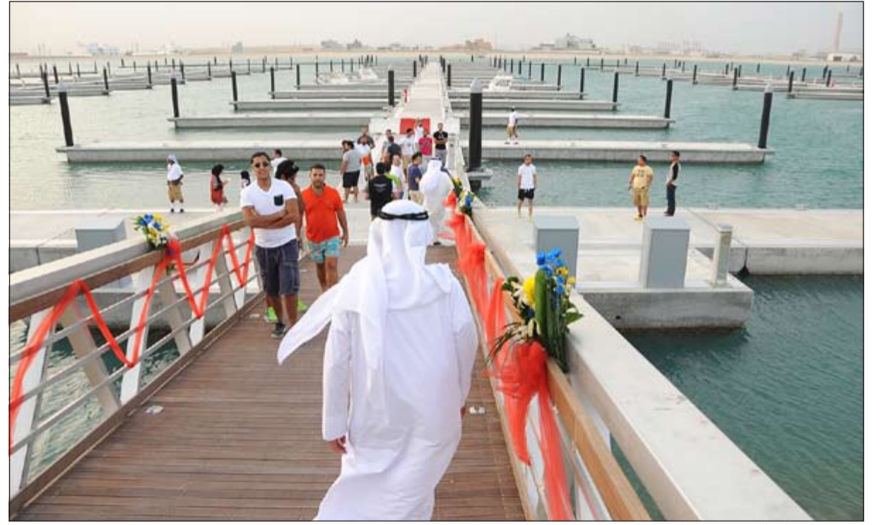
حضور لافت للمواطنين في المارينا