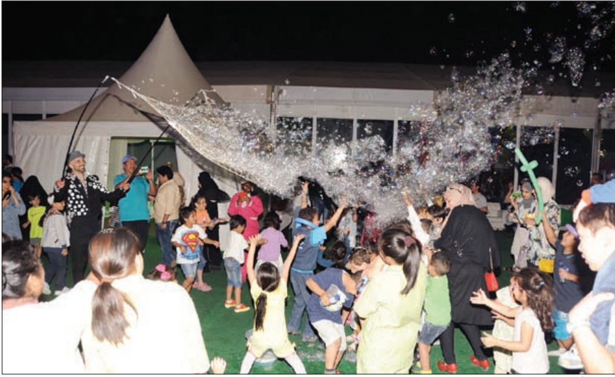
فرقة الأطفال بالفعاليات