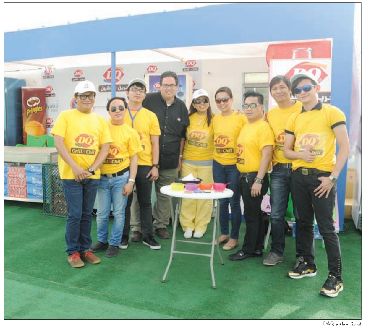
فريق مطعم D&Q

كان لهواة السيارات وعشاقها نصيب من الكرنفال، حيث قدم فريق ناصر الطريجي للسيارات الكلاسيكية عرضا مميزة نالت استحسان الحضور. هذا، وقد أشاد الحضور بعرض السيارات الكلاسيكية المتنوعة، مشيرين إلى أنه أضفى أجواء من البهجة وأعطى الكرنفال طابعا مميزا، ومنح الفرصة لمحبي السيارات الكلاسيكية لمتابعة مجموعة من هذه السيارات بطرازاتها الفريدة، والتي أعادت إلى أذهان من عاصروها ذكريات الشباب ومغامراته الفريدة.