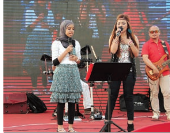
مواهب غنائية مشاركة