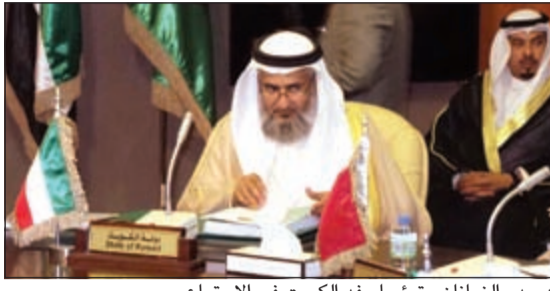
د. بدر الزمانان مترئسا وفد الكويت في الاجتماع

والقضائية بدول مجلس التعاون. وقال الزمانان ان وكلاء وزارة العدل لدول مجلس التعاون ناقشوا مقترح وزارة العدل بالملكة العربية السعودية بإعداد وتصميم وتنفيذ برامج تدريبية مشتركة بين دول التعاون في المجالين العدلي والقضائي، مشيراً إلى ان توصيات الاجتماع سيتم رفعها لوزراء العدل للبت فيها باجتماعهم المقبل المزمع عقده في العاصمة القطرية. وتناول الاجتماع مشروع اتفاقية تسليم المتهمين والحكوم عليهم بين دول مجلس التعاون لدول الخليج العربية إضافة إلى التباحث حول مواضيع العلم والإحاطة، لاسيما الموقع الإلكتروني للجنة وزراء العدل.