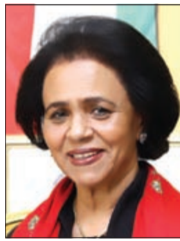
الشبيخة فريحة الأحمد

الإعلام القيام بالتوعية المستمرة من خلال مراكز وزارة الشؤون والمساجد في البلاد. وأضافت ان انشاء خط هاتف وإقامة مركز استقبال خاص بالليالغات والشكاوى العائلية بالتنسيق مع الجهات المختصة رسمياً يعتبران من الحلول التي يمكن ان تجنب المجتمع تفاقم العنف العائلي لاسيما عند حدوث الخلافات والمشاجرات. وأوضحت الشبيخة فريحة ان العنف يولد العنف بكل أشكاله وصوره سواء اللفظي منه او العملي، مشيرة الى ان استعمال العنف من قبل بعض الآباء يؤدي الى تنامي العنف لدى الأبناء، مؤكدة انه مؤشر خطير يجب الوقوف عنده ودراسة مثل