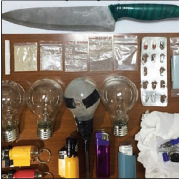
مذبوحات عشر عليها الامن العام مع متعرج على الأقدام