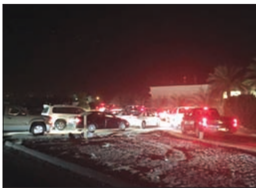
من حملة الاسطبلات