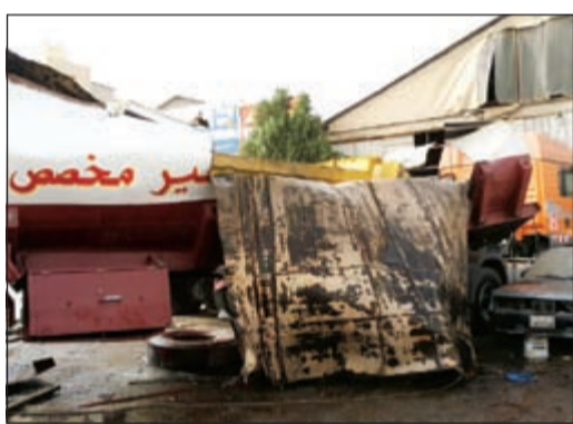
الصهريج وقد انفجر بفعل الغاز

من جهة أخرى، تعامل رجال إطفاء الفروانية مع حريق مجهول الأسباب في باص بمنطقة الضجيج وشروع رجال الإطفاء في تحديد الأسباب التي كانت وراء الحريق ومعرفة ما إذا المركبة مبلغ عن سرقتها أم لا.