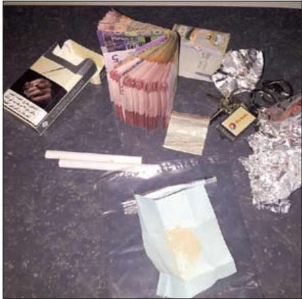
من مذبوحات «الفروانية»