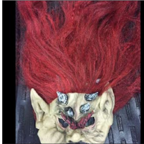
الباروكة والشعر الأحمر كشفا عن منتهي إقامة