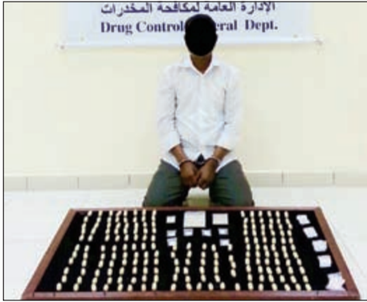
الهيروين امام الوافد داخل الكبسولات