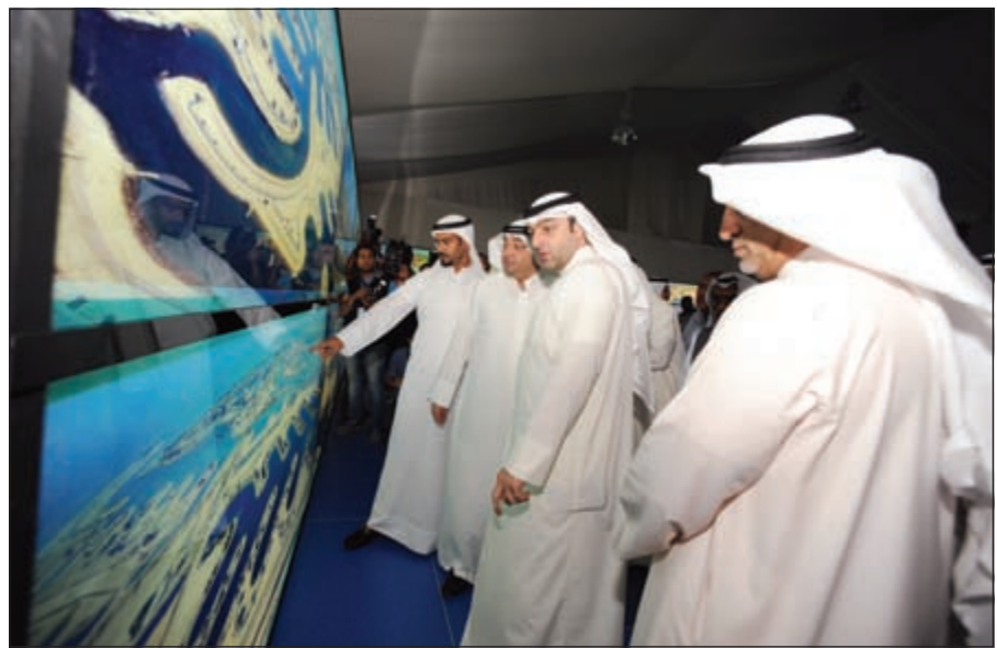
شرح مفصل للوزير عن مراحل مشروع مدينة صباح الأحمد البحرية

وردا على سؤال حول قانون من باع بيته واللاحة