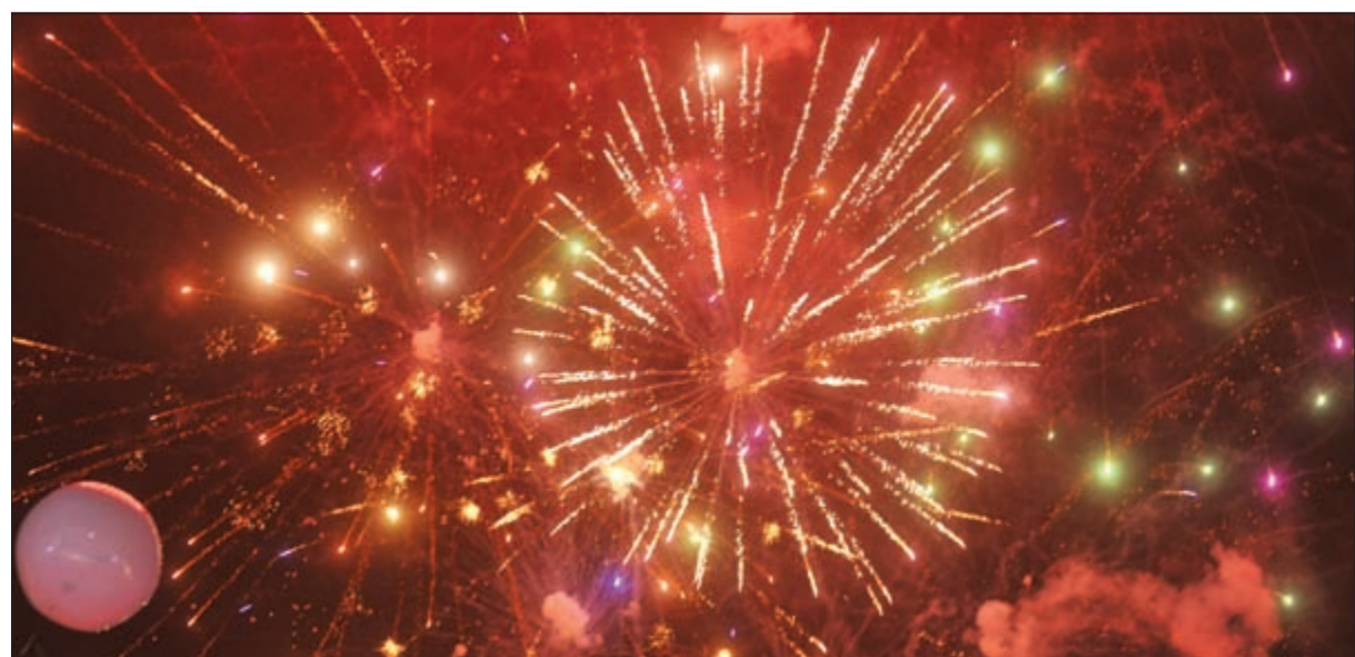
عروض مبهرة للمفرقات النارية خلال الافتتاح