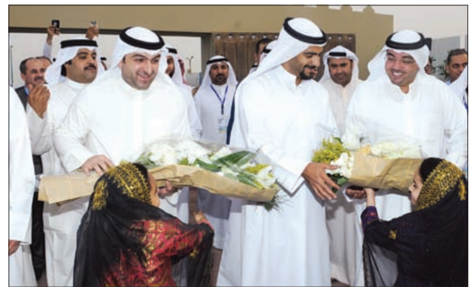
باقات من الورد خلال الافتتاح