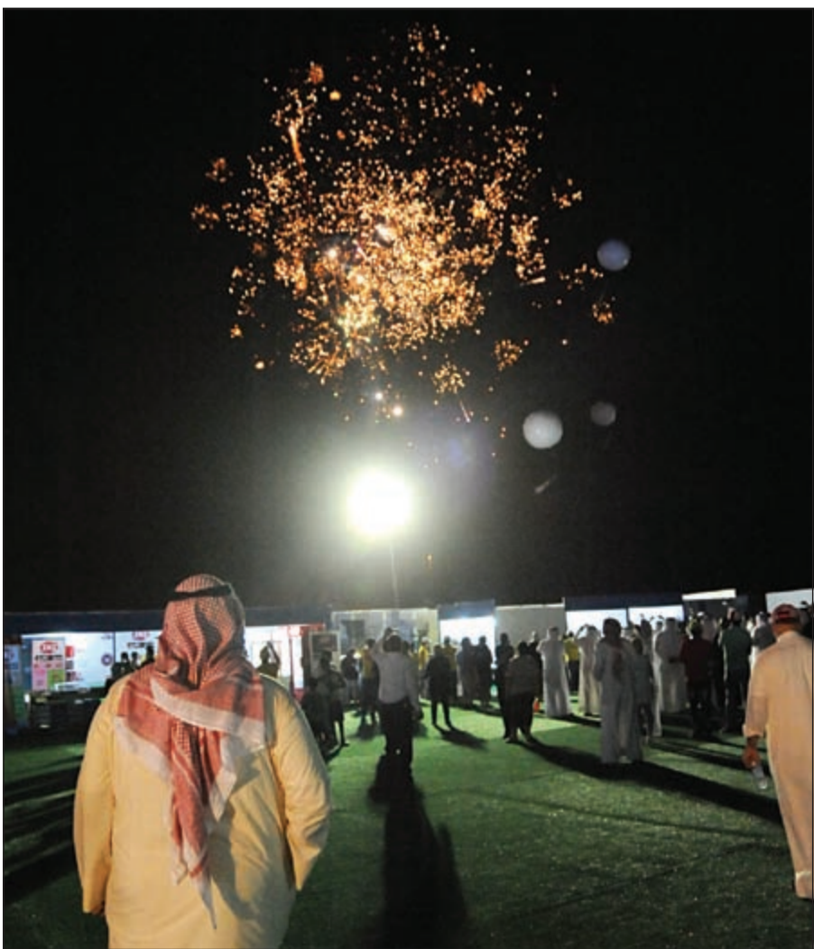
متابعة للألعاب النارية