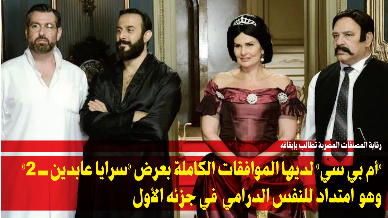
رقابة المصنفات المصرية تطالب بإيقافه

تعرضت الفنانة درة لحادث سرقة خلال قيادتها سيارتها على الطريق الصحراوي بين القاهرة والإسكندرية، حيث فوجئت درة في أثناء عودتها من تصوير مشاهد مسلسلها «بعد البداية»، بمجموعة أشخاص يقتحمون عليها الطريق بصفتهم معجبينها ويريدون الاطمئنان عليها، إلا أنها اكتشفت بعد ذلك سرقة السيارته وتقرب بـ 600 ألف جنيه، بحسب موقع «البيان». يذكر أن درة تقوم حالياً بتصوير أكثر من عمل درامي، ومنها: «بعد البداية»، «قسمني ونصبيك»، «مشاعر حائرة»، «ظرف أسود»، «ليلة الشك».