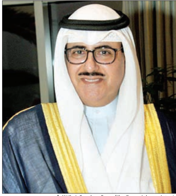
الشيخ فهد مبارك عبدالله الأحمد الصباح وكيل الإذاعة