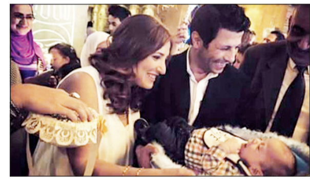
إياد نصار يحتفل بطفله الثالث

على الرغم من مرور أكثر من شهر ونصف الشهر علي ولادة ابنه، إلا أن إياد نصار قرر الاحتفال بابنه الثالث