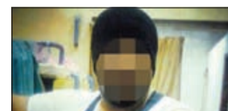
صورة حصرية لدعيس عمتهما أجهزة أمنية على منتسبها وانفردت بنشرها «الأخبار» أمس