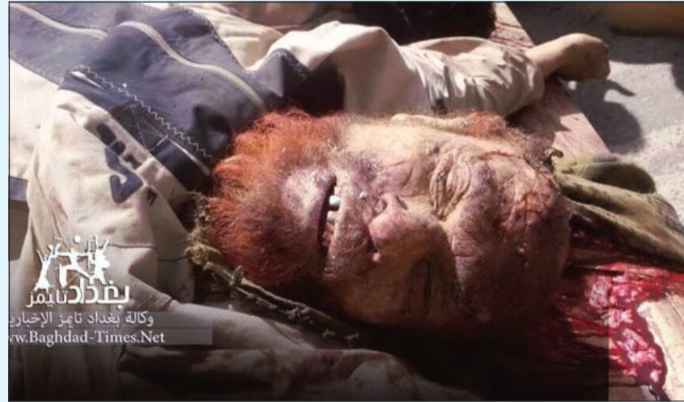
صورة انتشرت في المواقع العراقية الإلكترونية لجة «البريعصي» عزة الدوري

وكالات: وأخيراً.. اكتملت «الجنجفة»، بمقتل اخطر مجرمي الحرب في نظام الطاغية المقبور صدام حسين، حيث أعلن محافظ صلاح الدين «شمالي العراق» رائد ابراهيم الجبوري ان عزة ابراهيم الدوري المعروف بـ «البريعصي» زعيم حزب البعث المنحل ونائب المقبور صدام حسين قتل في عمليات للجيش العراقي شرق مدينة تكريت مركز محافظة صلاح الدين. وأضاف المحافظ: قتل «البريعصي» جاء خلال عملية استباقية في منطقة حميرين شرق تكريت.