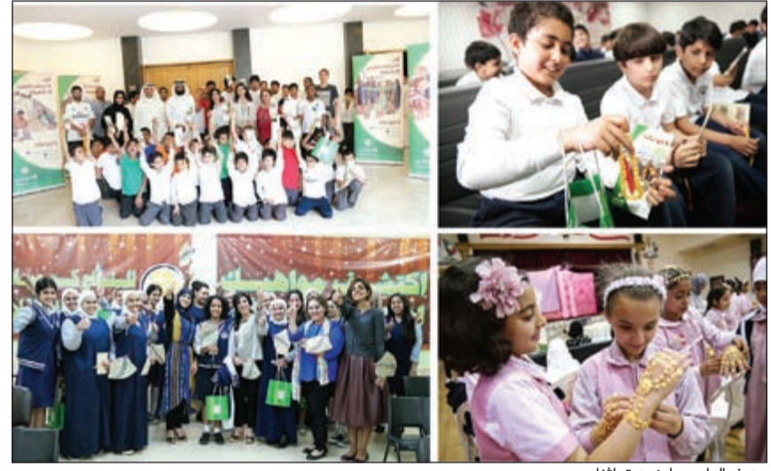
من فعاليات «يا زين تراثنا»

وطلب في المدرسة التي تزورها الحملة على هدية تذكارية بالإضافة إلى إهداء كل مدرسة كتاب «موسوعة اللهجة الكويتية»، ومجموعة من لوحات رزنامة البنك التجاري السايقة بالإضافة إلى مطبوعات تعريفية عن التراث الكويتي القديم. وكشفت عن أن البنك وعلى هامش فعاليات الحملة قام أيضاً برعاية المعرض الشبابي «بقشة»، الذي نظمه عدد من الشباب الكويتيات أصحاب الطموح والإرادة والتطور بهدف دعم وتحفيز المشاريع الصغيرة للشباب الكويتي الراغب في التحول تجاه العمل الحر، موضحة أن النجاح الكبير الذي حققته هذه الحملة وتجاوب الجمهور معها عبر قنوات التواصل الاجتماعي، كان بمنزلة علامة بارزة أخرى تضاف إلى سجل البنك الحافل بالعديد من مبادرات المسؤولية الاجتماعية واهتمامه وحرصه الدائم على إحياء التراث الكويتي القديم منذ أكثر من ربع قرن من الزمان، مؤكدة أن جهود البنك في هذا المجال تتواصل عبر السنين.