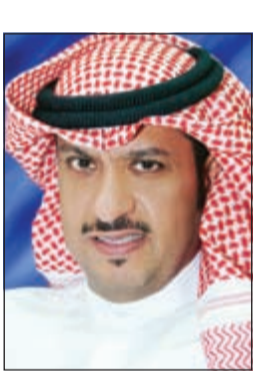
الشيخ طلال الخالد

التي تم تفعيلها تتم متابعتها والتأكد من جاهزيتها للتعامل مع الظروف كافة بشكل مستمر من قبل المسؤولين عن تطبيقها بالتعاون مع أجهزة الدولة الأخرى المعنية، وأشار إلى أن درجة الجاهزية قد تم رفعها منذ الوهلة الأولى لبدء عاصفة الحزم ومازالت على المستوى المطلوب لها ضمن خطة الإجراءات الاحترازية للقطاع النفطي المعتمدة.