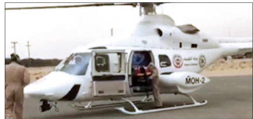
مطارة الإسعاف الجوي في العبدلي اثناء نقل المصاب