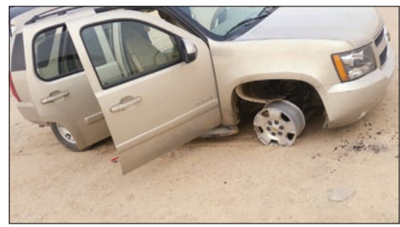
سيارة المتهم الهارب بعد العثور عليها

هذا، وقد عثر رجال الأمن على مركبة «الهارب» بعدما عم وكيل قطاع الأمن العام اللواء عبدالفتاح العلي أوصاف المركبة والإيعاز الى اللواء ابراهيم الطراح بتكثيف الانتشار الأمني الذي انتهى بالعثور عليها في منطقة سعد العبدالله. وتبين أنها قد تعرضت لطلاقات نارية اخترقت عدة أماكن من أجزائها. هذا، وذكر المصدر ان المتهم خلال هروبه قام بإطلاق النار عشوائيا في الهواء مما أصاب المارة بالذعر، كما علمت «الأنباء» أن مدير مديرية أمن الجهراء اللواء ابراهيم الطراح طلب من عموم الدوريات بإغلاق