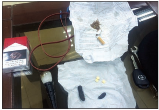
المضبوطات التي كشف عنها الاغماء

قطعة حشيش وحبوب مخدرة. ومن جانب آخر، فقد تحفظ رجال مخفر تيماء بتعليمات من المقدم غنيم العتل على مركبة تركها شخص وأطلق ساقيه للريح بعد طلب