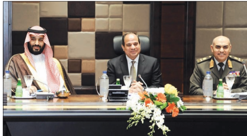
الرئيس المصري عبدالفتاح السيسي يتوسط صاحب السمو الملكي الأمير محمد بن سلمان بن عبدالعزيز وزير الدفاع ورئيس الديوان الملكي المستشار الخاص لخدمات الحرمين الشريفين والفريق أول صدقي صبحي القائد العام للقوات المسلحة ووزير الدفاع والإنتاج الحربي المصري في القاهرة