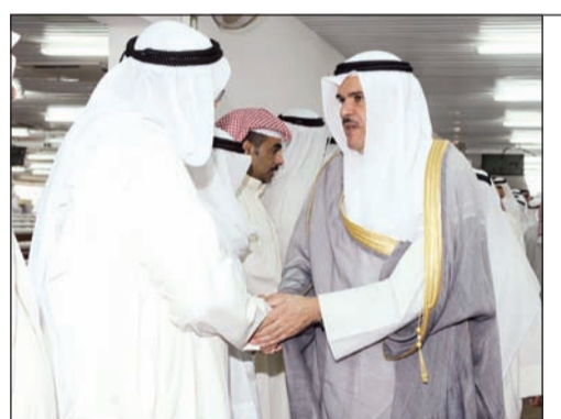
وزير الإعلام ووزير الدولة للشؤون الشباب الشيخ سلمان الحمود يقدم واجب العزاء

كشفت مصادر تربوية لـ «الأخبار» عن توجه وزير التربية ووزير التعليم العالي د.بدر العيسى لانتداب أكاديميين من جامعة الكويت لإدارة المناطق التعليمية التي سيحل محلها مديرها إلى التقاعد نهاية يونيو المقبل بعد بلوغهم السن القانونية، مضيفة ان المناطق التعليمية التي ستشغل مقاعدها هي: العاصمة، حولي، مبارك الكبير، والأحمدي. وقالت المصادر ان الوزير العيسى سينتدب الأكاديميين لمدة عام وبعدها سيخبرهم بين البقاء والعودة إلى الجامعة للتدريس، لافتة الى ان الأكاديميين سيكون دورهم إشرافيا من خلال المساهمة في وضع الخطط والإستراتيجيات المستقبلية للإدارات العامة في المناطق التعليمية، حيث يبحث د.العيسى كذلك تعيين نواب للمدير العام في كل الإدارات في المناطق إما من خارج الإدارة أو تكليف مدير الشؤون التعليمية بالإضافة إلى عمله رسميا كمنائب للمدير العام، بدلا من تكليف مديري المناطق التعليمية الأخرى بمهام المدير خلال إجازته، وذلك للمهام الكبيرة المنوطة بهؤلاء المسؤولين.