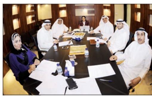
جانب من الندوة (هاني الشمري)

المشاركين في ندوة «الأخبار»: دعم المشروعات الصغيرة علاج ضروري لـ «البطالة» ومعالجة إشكالية تكديس 96٪ من العاملين الكويتيين في الحكومة 18 19