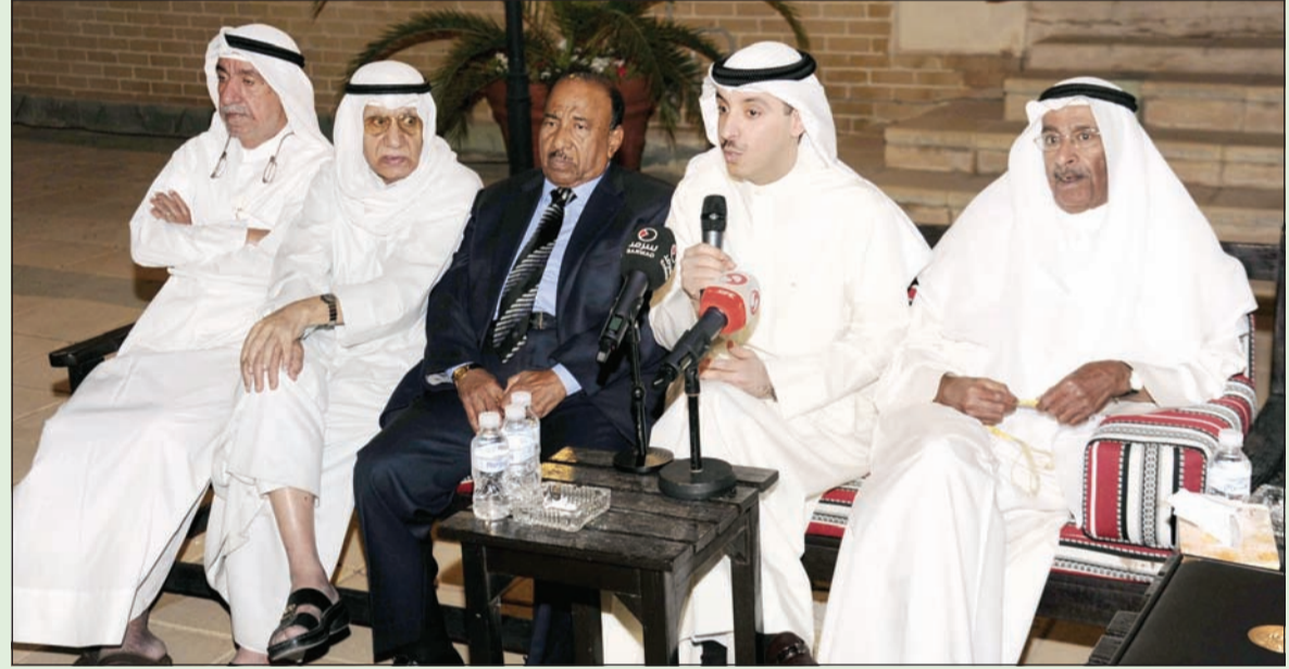
الملا يلقي كلمة أمام الحضور