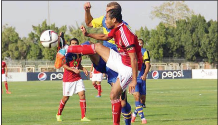
الأهلي يريد اجتياز عقبة الأسيوطي

إلى أي نتيجة إيجابية مع الأهلي اليوم، على أمل أن تعين لاعبيه على رفع معنوياتهم في الجولات القادمة، للخروج من المنطقة الخطيرة. من جهته أعلن مجلس إدارة نادي الزمالك المصري لكرة القدم، رسميا، عن تحديد ملعب ستاد السويس الجديد من أجل خوض مباراة الذهاب أمام فريق الفتح الرباطي المغربي في لقاء الذهاب لدور الـ 16 للكونفيدرالية الأفريقية المقرر لها يوم 19 أبريل الحالي. في شأن متصل، كرم منتخب مصر الأولمبي لكرة القدم، فوزه على حساب ضيفه بوروندي بهدفين دون رد في اللقاء الذي أقيم على ملعب السويس الجديد في المرحلة الأخيرة للتصفيات المؤهلة لدورة الألعاب الأفريقية. وفاز المنتخب الأولمبي دهايا في بوروندي ليضمن التأهل بشكل رسمي إلى دورة الألعاب الأفريقية التي تقام في سبتمبر المقبل في الكونغو.