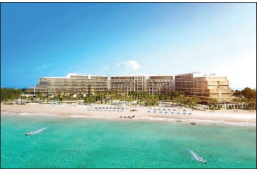
منظر عام للفندق