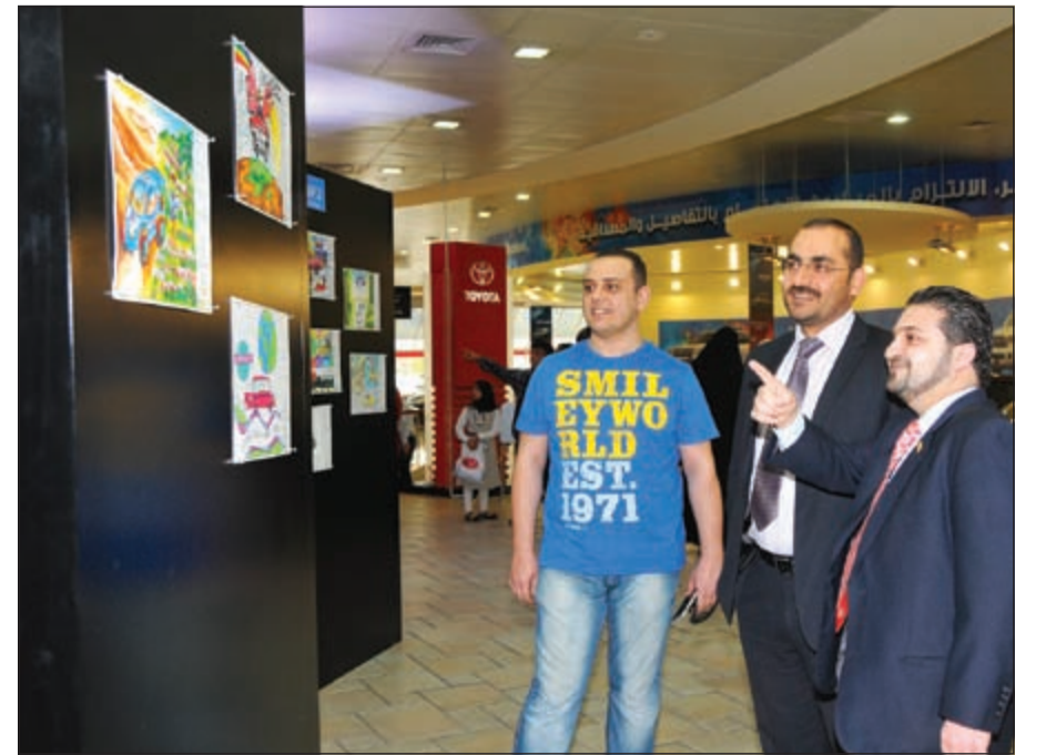
جولة على المعارض