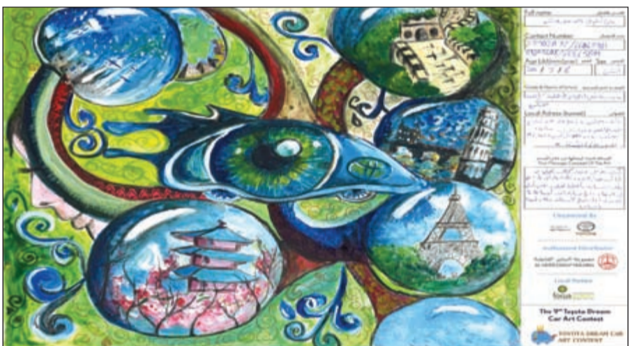
الفائز الأول في الفئة العمرية * من 12 سنة لغاية 15 سنة *