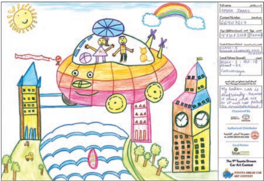
الفائز الأول في الفئة العمرية «أقل من 8 سنوات»

9 مرشحين نهائيين تاهلوا للجولة النهائية من المسابقة من 3 فئات عمرية مختلفة اختيار مشترك واحد من كل فئة عمرية كصاحب أفضل رسم إبداعي يفوز بجائزة مميزة