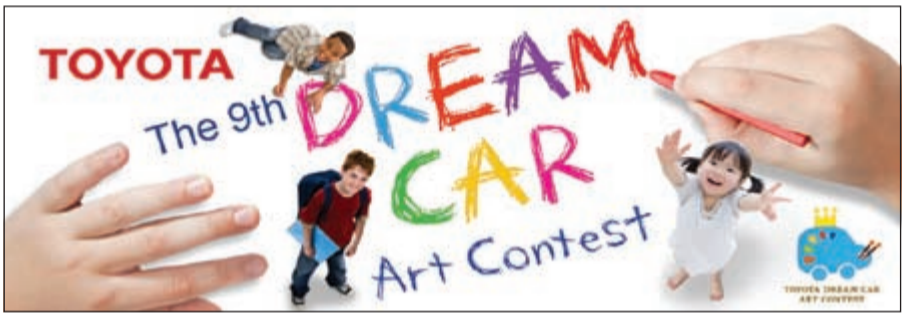
من بطرات المسابقة