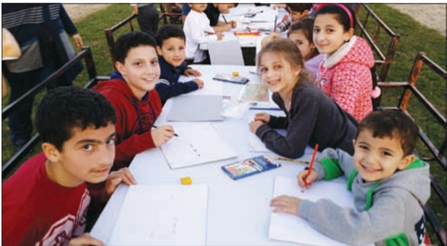
الأطفال يرسمون سيارات أحلامهم مع «تويوتا»