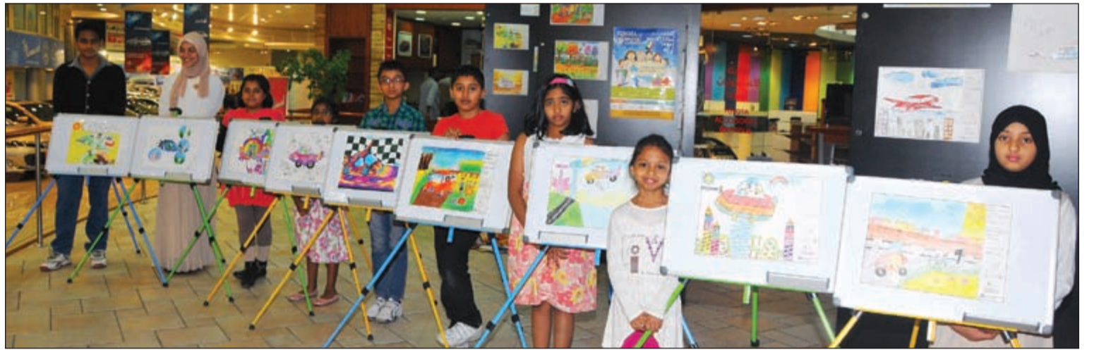
الفائزون الـ9 مع رسوماتهم