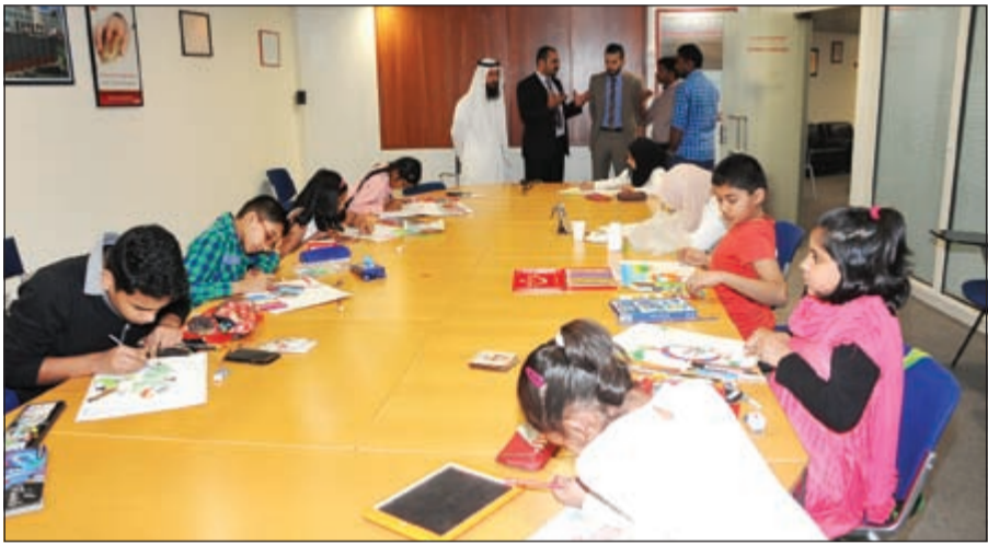
الأطفال يظهران إبداعاتهم برسم سيارة الأحلام مع «تويوتا»