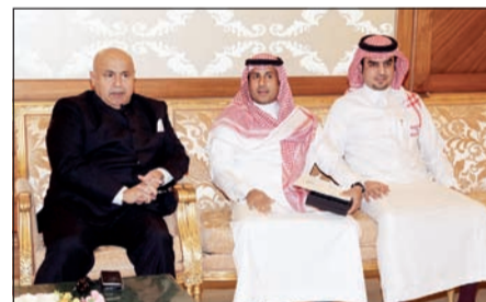
الفهد بعد تسلمه رسالة من مدير الأمن السعودي

تسلم وكيل وزارة الداخلية الفريق سليمان فهد الفهد رسالة من أخيه مدير الأمن العام بوزارة الداخلية بالملكة العربية السعودية الشقيقة الفريق عثمان بن ناصر المحرج، وتضمنت الرسالة دعوة لحضور التمرين السنوي الذي تقيمه قوات الطوارئ الخاصة صولة الحق تحت رعاية صاحب السمو الملكي ولي ولي العهد النائب الثاني لرئيس مجلس الوزراء وزير الداخلية بالملكة العربية السعودية الشقيقة الأمير محمد بن نايف بن عبدالعزيز، وذلك في إطار التعاون والتنسيق المشترك والعلاقات الأخوية التي تربط الشعبين الشقيقين. وقد قام بتسليم الرسالة قائد قوات الطوارئ الخاصة المقدم عبدالعزيز المطيري، والمحلق الديبلوماسي بسفارة المملكة العربية السعودية الشقيقة بالكويت النقيب إبراهيم المنيع.