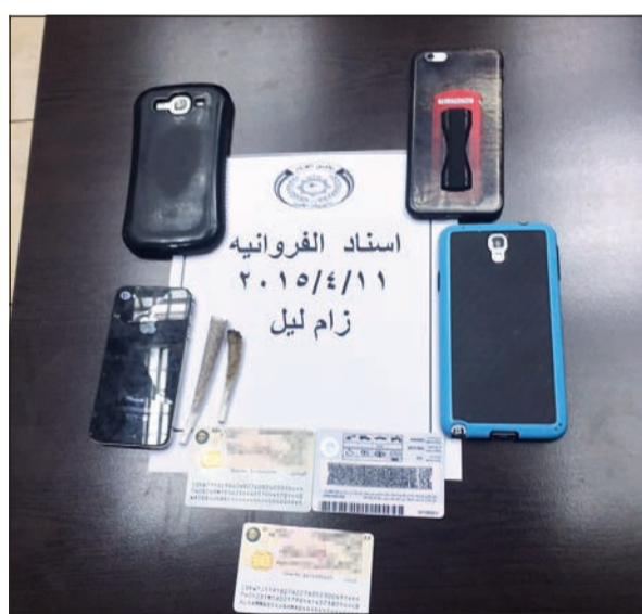
المضبوطات بحوزة الأمن العام

بحوزتهم على سيجارة كاملة من الحشيش ومادة داكنة اللون وقد تم إحالتهم إلى جهات الاختصاص.