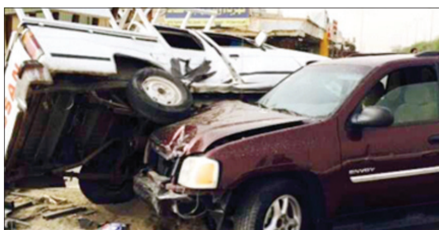
السيارتان وقد صعدت احداهما على الاخرى