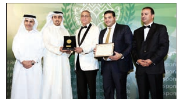
جانبا من تسلم درع التميز الذهبي

ويهدف المناسبة أعرب ناجيا واستقطب اهتمام جهات التقييم الدولية التي قررت منحه هذه الجائزة تقديراً لنشاطه المتميز في هذه المجال، وبعد أن أصبح محط أنظار المصارف والبنوك والمؤسسات المالية الأخرى ومنازل تقديرها، نظراً لشموليته وتنوع فعالياته وأنشطته على مدار العام، الأمر الذي يؤكد تميز أدائه ودقة وسلامة خطته واستراتيجيته في مجال المسؤولية الاجتماعية.