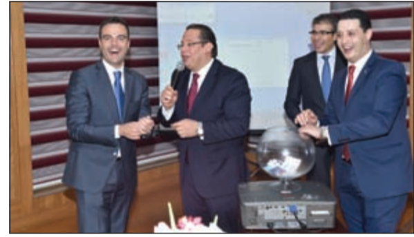
جاناب من الحفل وإعلان الفائزين بالجوائز