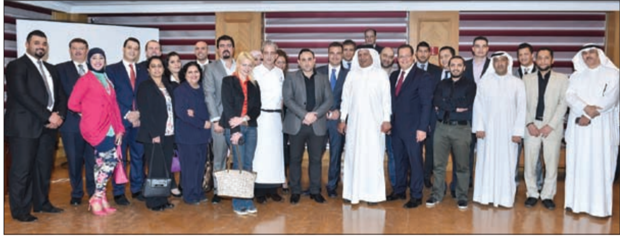
لقطة تذكارية لإدارة (الريتز كارلتون - البحرين) مع عدد من الحضور خلال الحفل

وذلك التقويم لأعضاء النادي الرياضي لعام 2015، واستمتع المئات من الضيوف في هذه الليلة الرائعة، مع عشاء لذيذ وأجري السحب على الجوائز. وكانت هذه هي المرة الأولى التي تقوم فيها إدارة فندق رئيسي في البحرين بالسفر إلى الكويت لشكر العملاء انطلاقا من شركتها