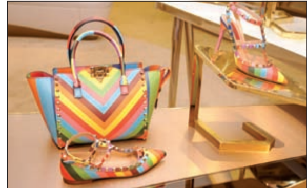
حقيبة وحذاء بلوان متناسقة

هذا الموسم، لكنه حرص على إبراز الطابع الأنثوي فيها. أما علامة Manebi الإسبانية فقدمت تصاميم فنية رائعة مستوحاة من بعض المناطق الأوروبية، كما لاقت تشكيلة Sergio Rossi استحسانا من الضيوف لترتكز تصاميمه على الأنوثة والعصرية. يفخر هارفي نيكلز على مدار السنوات بعرض أرقى صيحات الموضة لأشهر المصممين من عواصم الموضة حول العالم، بما فيها باريس وميلانو ولندن ونيويورك. وتأتي حملة «Think Inside of the Box» لتكشف لأصحاب