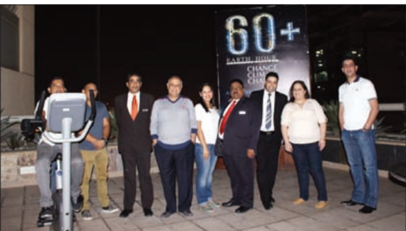
من فريق «المنشر روتانا» خلال «ساعة الأرض»

أعضاء الفندق في الأجزاء التي تختص بالخدمات والإدارة وغالبية المناطق العامة وكذلك الأجزاء الخارجية. كما شارك نزلاء الفندق الحريصون على البيئة بهذه المبادرة.