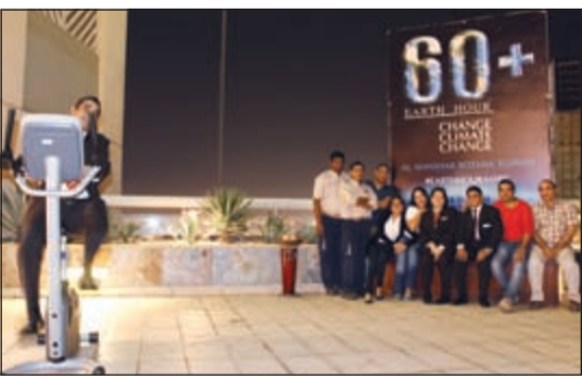
مشاركة في توليد الطاقة من الدراجة

شارك فندق المنشر روتانا، الفندق الرائد من فئة الخمس نجوم في الكويت مرة أخرى في مبادرة تغيير المناخ العالمية، وهي المبادرة التي أطلقها صندوق الحياة البرية العالمي، مما يدل على التزام الفندق بحماية البيئة والتخفيف من آثار تغير المناخ.