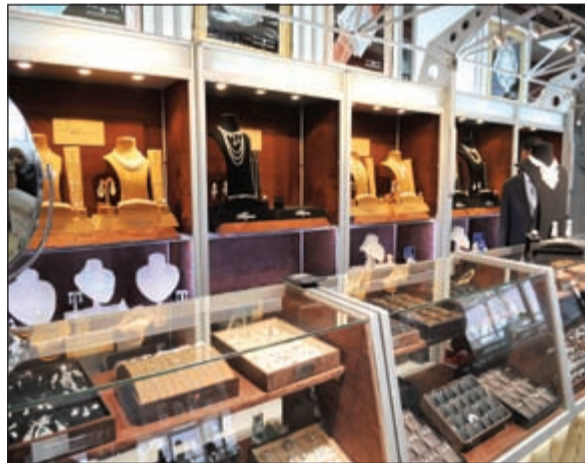
مجوهرات الفارس.. لأصحاب الذوق الرفيع

القطع الضخمة شديدة النقاوة، وبالغفل نجحنا في تحقيق المعادلة الصعبة من ناحية جمال التصميم، ونقاوة الألماس، والسعر المناسب. وأشاد فاسر بالمرأة الكويتية «لأنها مطلعة باستمرار على أحدث ما طرح في الأسواق من مجوهرات، ولأمتلاكها ذوقا رفيعا، ولكونها تبحث دائما عن الخصوصية فليس من السهولة أن تقتنع بما يقدم لها، لذا نحرص على صناعة القطع القيمة لها لتجد لدينا ما تحتاجه».