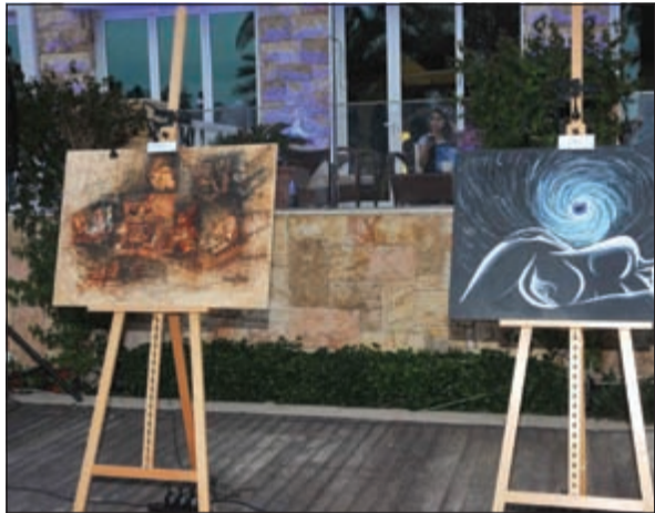
من اللوحات المعروضة