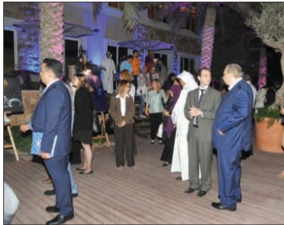
جولة للحضور في المعرض