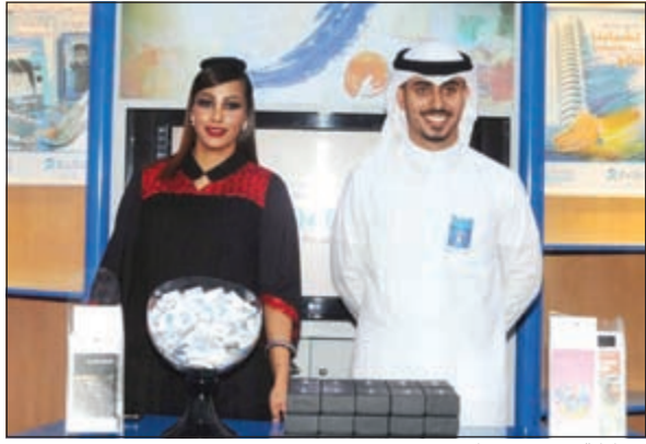
مشاركة من بنك برقان