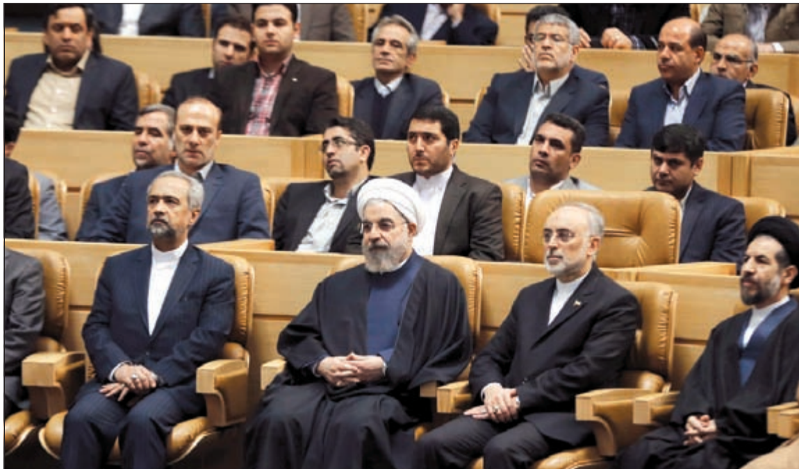
الرئيس الإيراني حسن روحاني خلال حضوره احتفالات طهران بيوم التكنولوجيا النووية أمس الأول (1).

عواصم- وكالات: تتبادل القوات الحكومية الأوكرانية والانفصاليون امس الاتهامات بانتهاك وقف إطلاق النار المتفق عليه بين الجانبين في المناطق الشرقية من البلاد. ونقلت وكالة الانباء الأوكرانية عن مصادر عسكرية في كييف قولها ان قوات الدفاع الذاتي التابعة للانفصاليين في شرق اوكرانيا انتهكت وقف إطلاق النار 21 مرة خلال 24 ساعة.