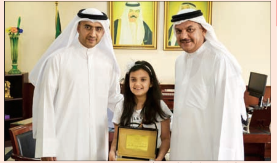
فرح تتوسط والدها ووكيل وزارة التربية د.هيثم الأثري