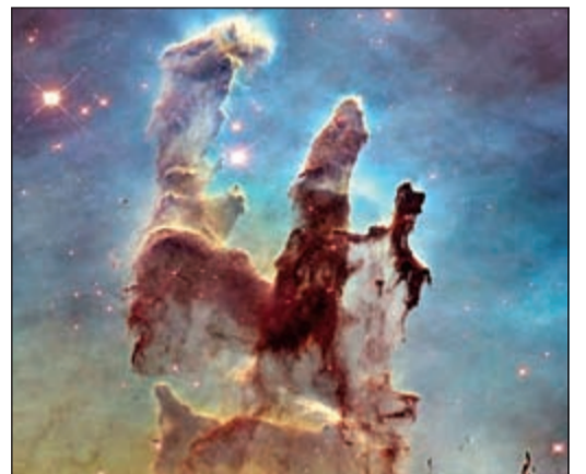
صورة مذهلة التقطتها ناسا لما يسميه علماء الفضاء اعمدة الخلق

أتلانتا - سسي.إن.إن: أشار علماء وكالة الفضاء الأميركية، ناسا، إلى احتمالية العثور على مخلوقات فضائية بحلول عام 2025، إذ قالت مديرة علماء الفضاء بالوكالة، إلين ستوفان في ندوة حول وجود المياه في الفضاء، إن العلماء سيعثرون على «أدلة قوية على وجود حياة خارج الأرض خلال عقد من الزمن»، مضيفة بقولها: «أعتقد بأننا سنعثر على مثل هذه الأدلة ما بين 20 إلى 30 عاماً».