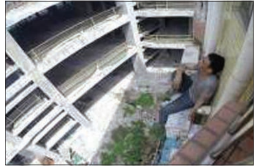
الشاب الصيني معلقاً خارج أحد الفنادق

بكين - وكالات: أمضى شاب صيني ثلاثة أيام وهو معلق خارج أحد الفنادق لأنه لم يرغب في أن تعتقله الشرطة وبسبب العار لوالدته المستمة.