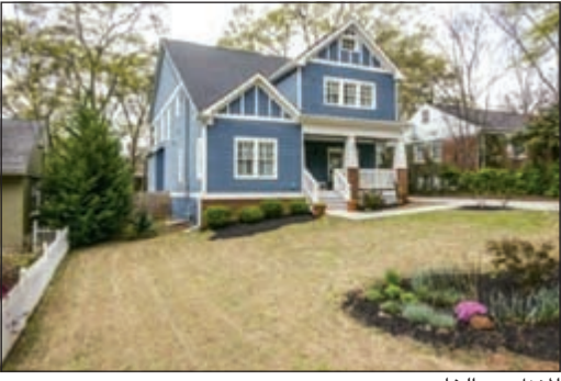
المنزل من الخارج