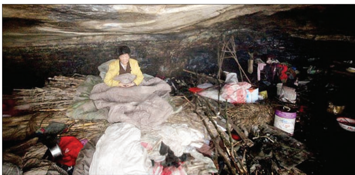
دو ميانغ داخل الكهف