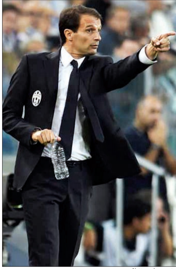
أليغري صاد مونتيلا

حيث ضمن مقعد في المباراة النهائية لكأس إيطاليا وحسم الدوري العام بنسبة 90٪، وكذلك وصوله لدور الثمانية لدوري الأبطال أوروبا، وهذا ما أسعد جماهير البيلانكونيري وانسأهم الرحيل المفاجئ للمدرب انتونيو كونتي. بدوره، شكر زميله أحمد الصفار صحيفة «الأنباء» على إتاحتها الفرصة للشباب للتعبير عن آرائهم وهوياتهم وقال: كان أغلب عشاق السيدة العجوز في تحسوف وحذر بسبب الخسارة في معقلهم بمباراة الذهاب، ولكنني كنت متفائلا بسبب ما قدمه الفريق في آخر المباريات من مستوى وتكتيك عال ويرجع الفضل بذلك للمدرب الأليغري. وتابع: نجومنا لم يخيبوا الظن في مباراة الإياب وقادوا يوفنتوس لانتصار مستحق وكاسح بـ 3 أهداف نظيفة ضد فيورنتينا لنيل نهائي الكأس الغالي الغائب عن خزائن الفريق لسنوات طويلة، ونتمنى الاستمرار على هذا الأداء في مختلف المسابقات الأوروبية والمحلية.