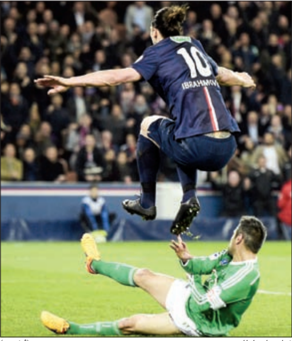
فنان يا سلطان