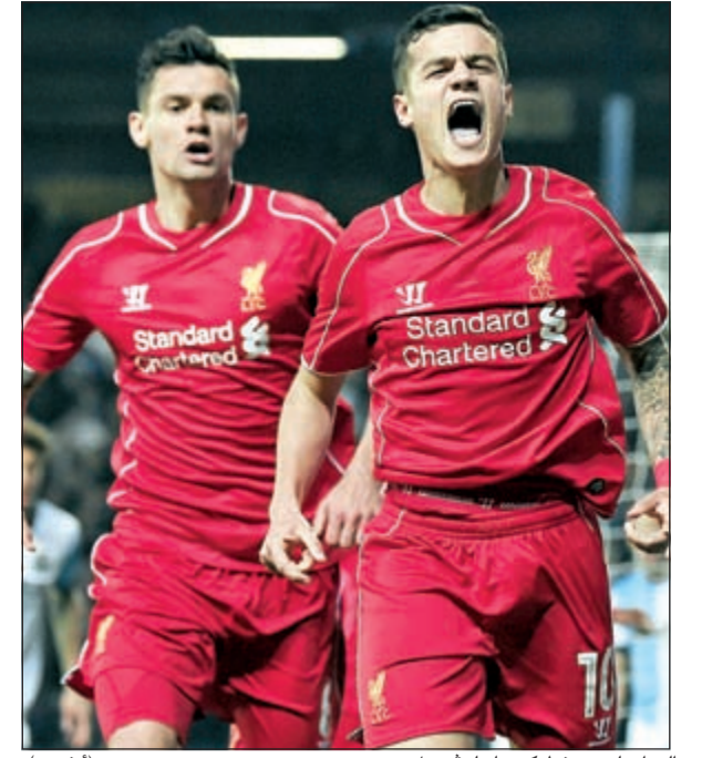
البرازيلي يحفظ كبرياء ليفربول

نابولي ضحية لـ «النسور».. و«البافاري» يلاقي دورتموند في المربع الذهبي.. و زلاتان يقود سان جرمان إلى نهائي «Coupe de France»