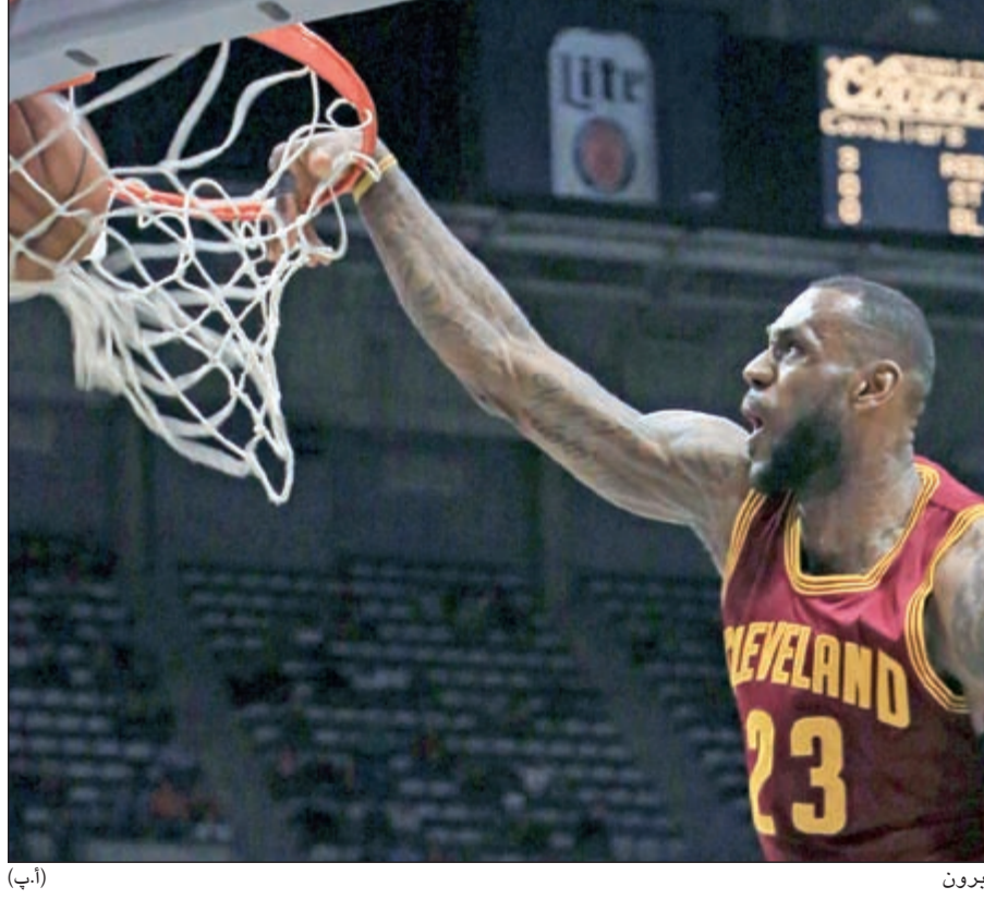
أرحم السلة يا لبيرون

سجل نجم كليفلاند كافاليرز لوبرون جيمس ثلاثية قبل نهاية مباراة فريقه مع ميلووكي باكس بـ 14,9 ثانية ليقتوده إلى الفوز 104-99 ضمن دوري كرة السلة الأمريكي للمحترفين. وحقق ميلووكي الذي كان ضمن بطاقة التأهل إلى البلاي أوف فوزه الرابع على التوالي وعزز رصيده في المركز الثاني بـ 51 انتصارا مقابل 27 خسارة. وأنتهى جيمس المباراة بتسجيله 21 نقطة ونجاحه في 9 متابعات و8 تمريرات حاسمة، في حين كان زميله كاسيري ايرفينغ أفضل مسجل في صفوف كافاليرز (27 نقطة)، وأضاف كيفن لاف 16 نقطة و11 متابعات. وعلى الرغم من ضمان أتلانتا هوكس تصدر المجموعة الشرقية، فإنه يقدم عروضاً قوية قبل دخوله معترك البلاي أوف بدليل فوزه على بروكلين نتس 114-111. وخطا بوسطن سلتيكس خطوة جيدة نحو انتزاع بطاقة التأهل إلى البلاي أوف بفوزه على ديترويت بيستونز 113-103. وتابع سان انطونيو سبيرز حامل اللقب الموسم الماضي عروضه القوية